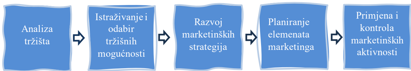
Slika 1 Proces upravljanja marketingom