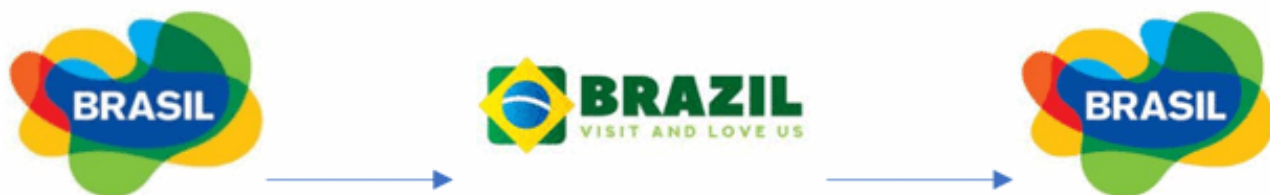
Slika 9 Kronološki prikaz mijenjanja loga Brazila