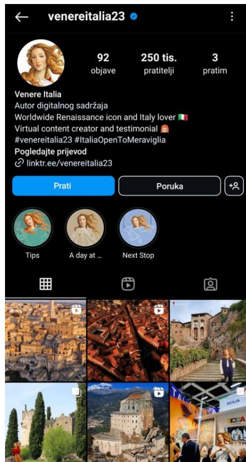
Slika 5 Instagram profil venereitalia23 na dan 18.03.2024.

Izvor: Instagram, venereitalia23 https://www.instagram.com/venereitalia23/ , pristupljeno 18.03.2024.