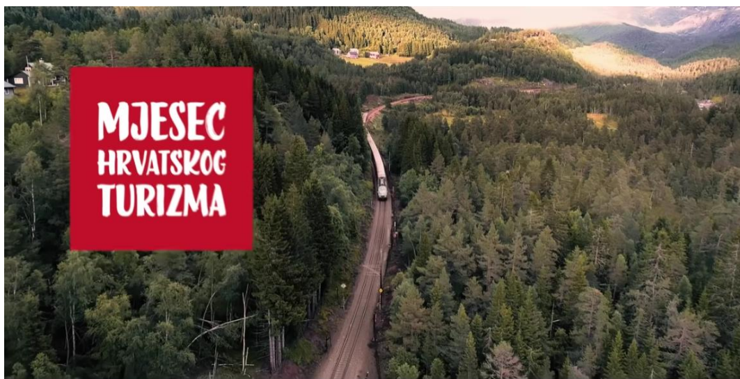
Slika 4 Prikaz linije Oslo-Bergen u promotivnom videu HTZ-a