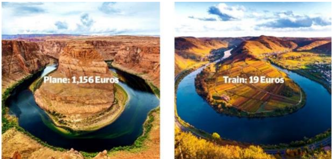
Slika 2 Usporedba Arizone u SAD-u i Rhinelanda u Njemačkoj