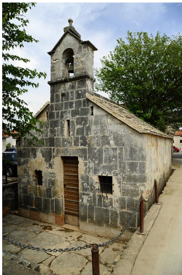
Slika 3. Crkva sv. Antuna Opata

Na sredini istočnog, sjevernog i južnog zida je uski pravokutni prozor. Unutrašnji prostor sastoji se od jednostavnog i malenog jednobrodnog pravokutnog tlocrta, čije bočne stijene u cijeloj svojoj duljini prelaze u šiljasti svod, koji svojom jedinstvenom konstrukcijom prekriva unutrašnji prostor. Pod crkve izrađen je od velikih, kvadratnih kamenih ploča, a uz zid vrata je uzidana valjkasta kamena posuda za vodu s istaknutom trakom na gornjem i donjem bridu. „Crkva sv. Antuna Opata izgrađena je na prijelazu iz 14. u 15. stoljeće u stilu gotičke pučke arhitekture. Nadsvođena je šiljastim svodom, koji svojom jedinstvenom konstrukcijom prekriva unutrašnji prostor. Oslíkana je freskama u prvoj četvrtini 15. stoljeća. Na bočnim zidovima i na svodu nižu se u dva pojasa prizori iz legende o sv. Antunu Pustinjaku. Po zidovima crkve ugrebano je mnogo grafita te crteža niza jedrenjaka i galija iz 15. i 16. stoljeća.“ 10