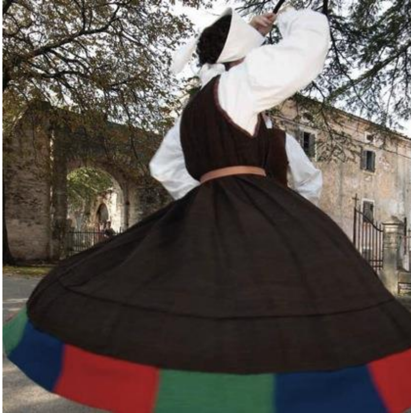
Slika 7. Narodna nošnja Barbanštine