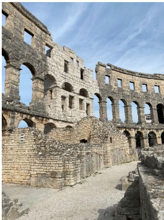
Slika 3. Toranj s vodospremom