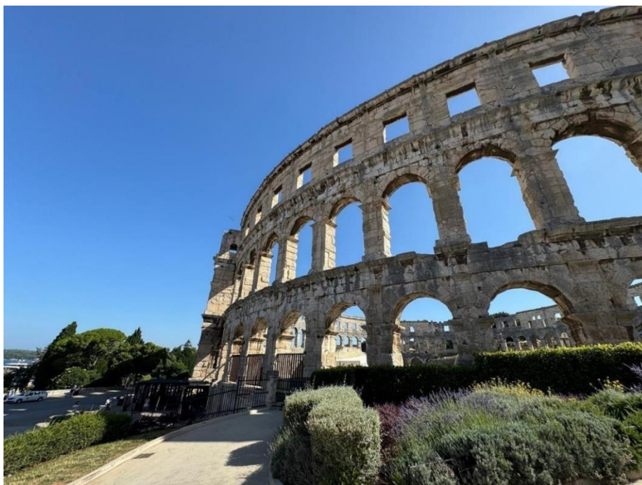
Slika 2. Amfiteatar u Puli