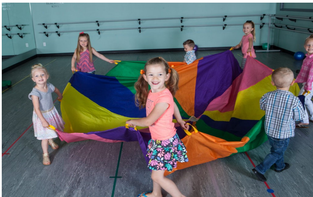
Slika 4. Pokretna igra (UDA Creative Arts Preschool, 2017)

Zapravo je vrlo bitno usredotočiti se i na fizički i na mentalni razvoj djece predškolske dobi jer pokretne igre za predškolarce nisu samo zabavne, već su i neophodne za razvoj djeteta. Tjelesna aktivnost u predškolskoj dobi je važna, a njezine dobrobiti traju i nakon završetka predškolske dobi. Predškolarci koji imaju dovoljno vremena za igru i tjelesne aktivnosti također imaju jače kognitivne, socijalne i emocionalne vještine, adekvatan razvoj mišića, kostiju i zglobova, povećanu sposobnost učenja i pamćenja, veće samopouzdanje, bolju koncentraciju, manje zdravstvenih problema te općenito vode zdraviji način života. I ne samo to, pokretne igre daju djetetu prednost u socijalnoj interakciji i komunikacijskim vještinama. Djeca uče rješavati probleme dok također uče važne stvari poput brojanja i boja (UDA Creative Arts Preschool, 2017).