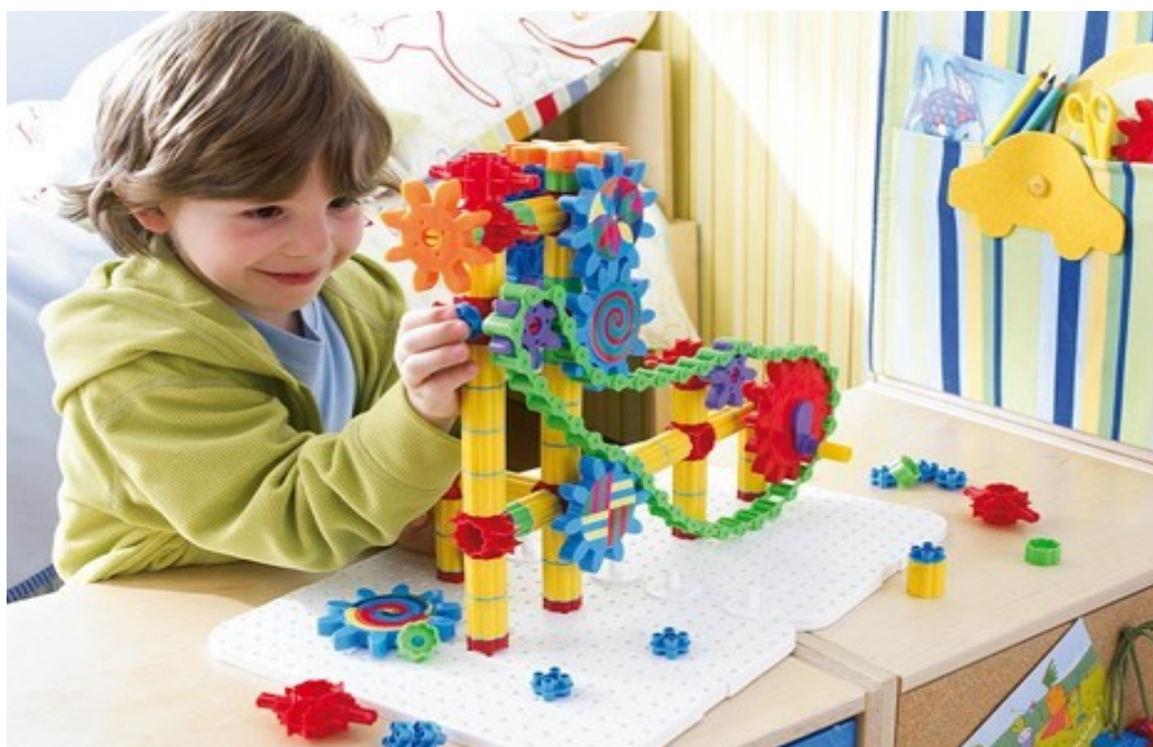
Slika 5. Igra konstruiranja (Ida didacta, 2024)

Još jedna vrsta igre koja pridonosi motoričkom razvoju je igra konstrukcije, koja uključuje korištenje različitih građevinskih materijala kao što su blokovi, slagalice te umetanje pločica za stvaranje različitih oblika ili predmeta. Osim poticanja motoričkih sposobnosti, igra konstrukcije potiče i obrazovne vještine. Posebno je korisna za razvoj fine motorike, koja je neophodna za zadatke poput pisanja. Djeca koja imaju problema s koordinacijom mogu se suočiti s izazovima kada pokušavaju izgraditi visoku kulu od kocaka. Vizualna domena je pod velikim utjecajem ove posebne vrste igre, potičući razvoj različitih vještina. Djeca stječu potrebne vizualno-prostorne sposobnosti za zadatke poput pisanja i matematike, stječu razumijevanje odnosa između objekata u dvodimenzionalnom i trodimenzionalnom prostoru. Kroz igre konstrukcije, djeca proširuju svoj rječnik dok opisuju svoje radnje. Stječu jezične, čitalačke i matematičke vještine razvrstavanjem konstrukcijskih dijelova na temelju oblika, boje i veličine, konstruirajući modele i baveći se izračunima (Likierman, 2007). Zapravo, kocke su puno više od puke kocke. Djeca mogu graditi robote, dizalice, vozila ili visoke nebodere, a u spretnim rukama kocke se pretvaraju u dvorce, labirinte, farme, brodove ili gradove. Sa svakom kreacijom, njihova logika, koncentracija, preciznost i kreativnost će jačati, poboljšavajući njihovo razumijevanje vlastitog okruženja (Ida didacta, 2024).