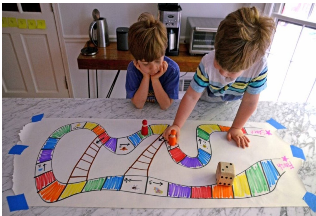
Slika 8. Igra s pravilima (Beth, 2019)

Možemo zaključiti kako je u području obrazovanja u ranom djetinjstvu vrlo važna integracija igre s pravilima. Štoviše, poštivanje pravila u igri usađuje osjećaj poštenja i pravde, njegujući moralni kompas koji vodi donošenje etičkih odluka. Kao odgojitelji, promicanje igre s pravilima postavlja temelje za razvoj odgovornih, empatičnih pojedinaca koji mogu napredovati u raznolikom i međusobno povezanom društvu. Odgojitelje se potiče da stvaraju okruženja koja nude niz mogućnosti za igru, u rasponu od slobodne igre koja potiče kreativnost do vođene igre s pravilima koja izgrađuje kognitivne i društvene vještine. Ova ravnoteža osigurava da djeca dobiju sveobuhvatan razvojni poticaj, njegujući njihovu neovisnost i sposobnost funkcioniranja unutar strukturiranog društvenog okvira (Early Childhood Education, 2024).