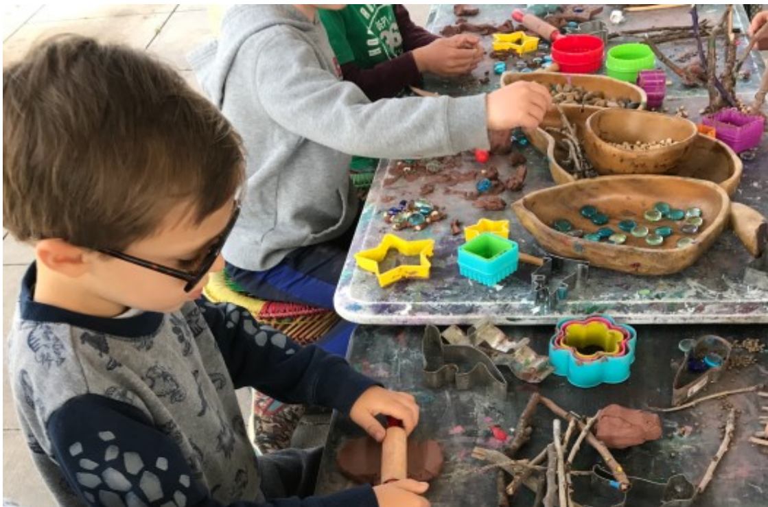
Slika 6. Stvaralačka igra (Spramani, 2023)

Stvaralačka igra može se kategorizirati u tri osnovne vrste, a svaka zahtijeva posebne vještine na temelju uključenih materijala, a to su: umjetnički pribor kao što su olovke i bojice, zatim materijali za kiparstvo te glazba (Likierman, 2007).