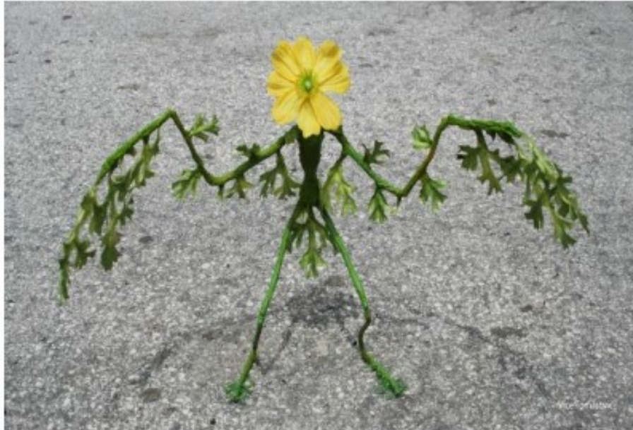
Slika 3. Primjer bizarnog predočavanja (Cvitković, 2019)