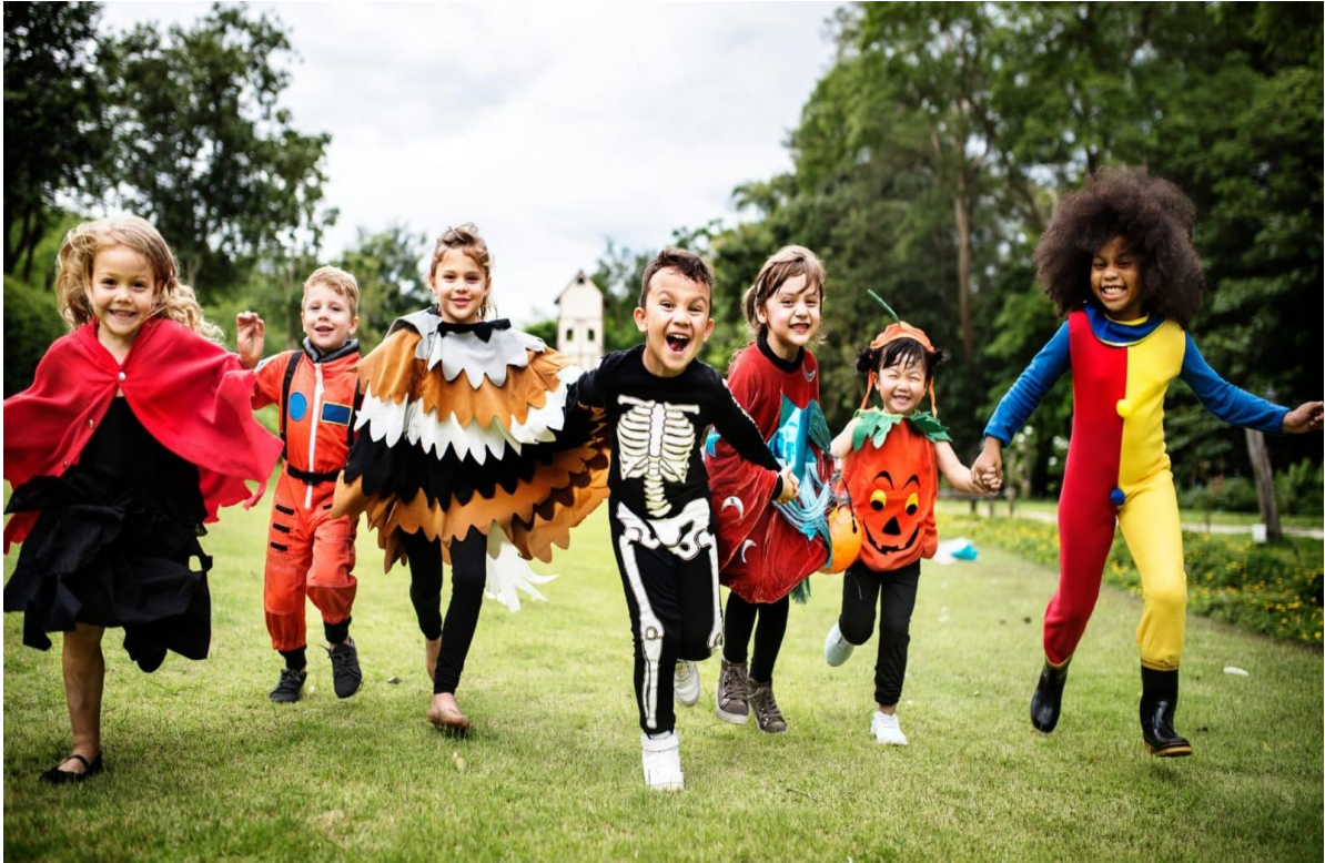
Slika 7. Dramska igra (Novak, 2023)