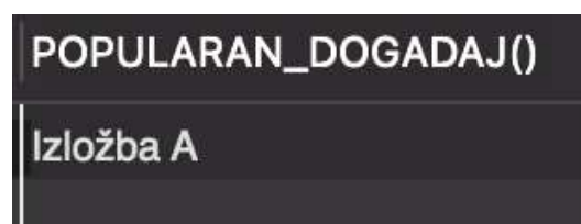
Slika 20: Prikaz popularnog događaja

Napravljena je funkcija 'POPULARAN_DOGADAJ'. Funkcija vraća naziv najpopularnijeg događaja s najviše ocjena. Ova funkcija pomaže zaposlenicima procijeniti koji je događaj popularan. Funkcija vraća jedan popularan događaj.