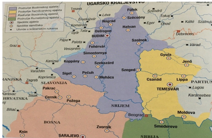
Slika 2. Osmanska uprava u Ugarskoj