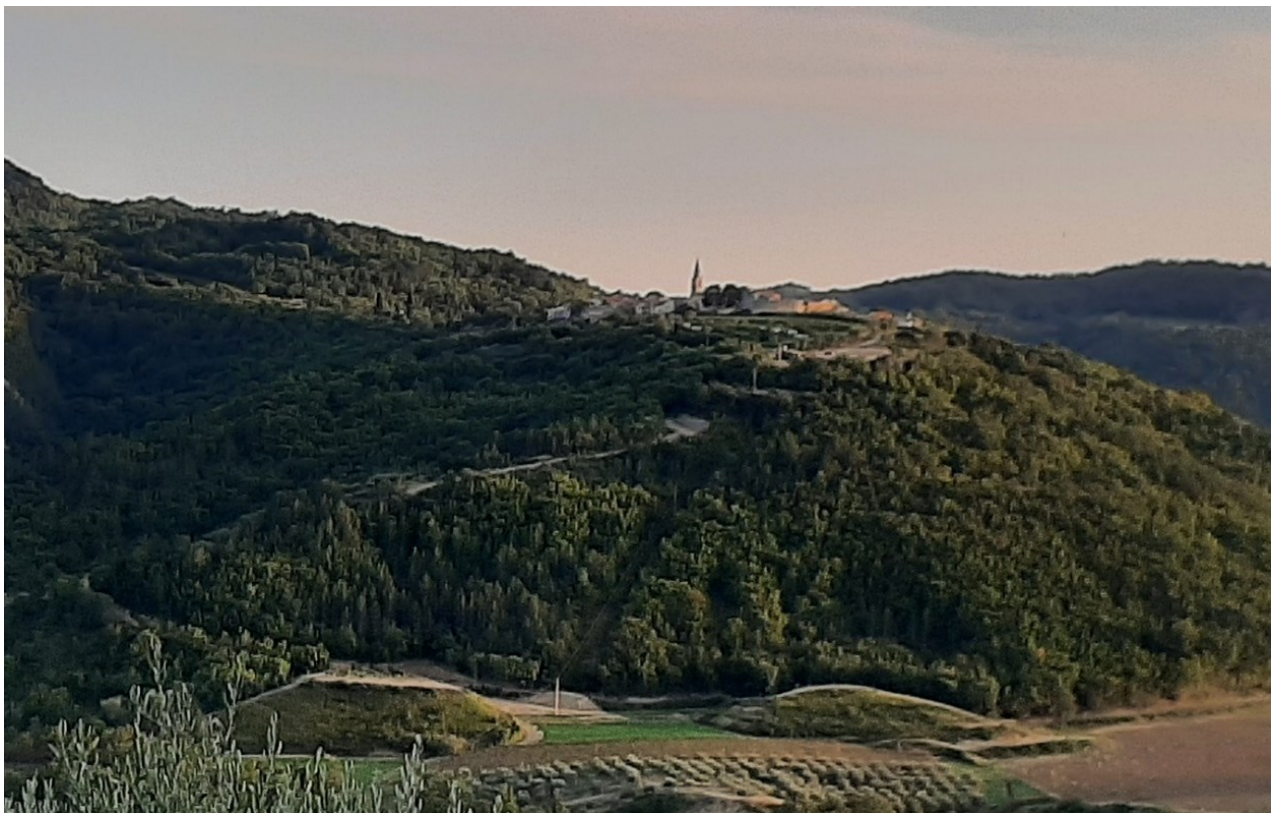
Slika 26. Pogled iz obližnjeg brda na kaštel Draguć.

Kaštel Draguć udaljen je tek 18 kilometara od Pazina, središta Pazinske knežije, te ga je austrijska vojska u više navrata htjela ponovno vratiti pod svoju vlast, ali bezuspješno. 91 Još prije rata, zbog nerazriješenih granica, okolica je Draguća i knežije bila vrlo napeta. Situacija je bila toliko napeta da je svećenik glagoljaš u crkvi Sv. Roka na zidu izgrebao dramatičan grafit: „1615. dedebra (=prosinca) dan prvi, be požgan borg pred Draguć od Oskok“. 92 Jedan od jačih napada na Draguć bio je u travnju 1616., kada je 200 austrijskih konjanika i 200 uskoka prošlo kroz Draguć i potom otišlo u selo Račice, gdje je bio Domician Zara, mletačka uhoda.