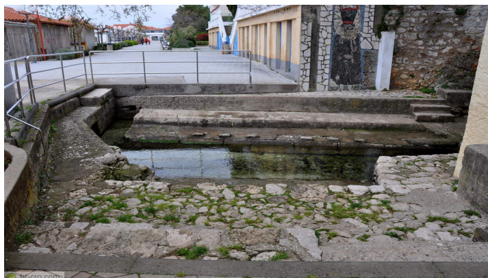
Slika br. 9 – Polača