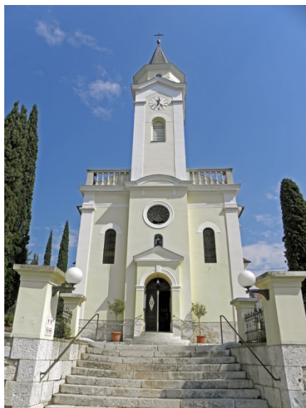
Slika br. 5 – Župna crkva svete Katarine