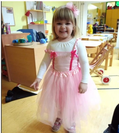
Slika br. 19 – Maškare u Dudačima

U prostorijama vrtića provodile su se razne kreativne aktivnosti, poput izrade maski od kaširanog novinskog papira koje su djeca kasnije oslikavala temperama. Nakon jutarnjih radionica, okupljanje se odvijalo u holu vrtića gdje su zajedno s grupama "Šareni svijet" i "Delfini" uživali u maskenbalu, natjecateljskim igrama, a za stariju djecu organizirana je i tombola. Maskirane odgajateljice pozivale su djecu da predstave svoje kostime na "pozornici", omogućujući svakom djetetu da pokaže svoju masku. Nakon plesa i igara, uslijedio je najdraži dio dana – ukusne fritule koje su pripremile vrijedne kuharice vrtića.