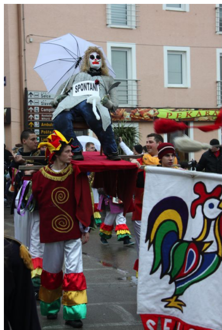
Slika br. 15 – Mesopust, lutka od slame