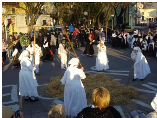
Slika br. 16 – Mlaća prazne slame

slama gori, običaj Selčana je da gledaju u kojem smjeru ide plamen vatre. Ako ide prema kopnu, mjesto čeka „leto od zemlje“, a ako ide prema moru mjesto čeka „leto od ribe“, što je uvijek bolja opcija (Njavro, 2002: 48-58).