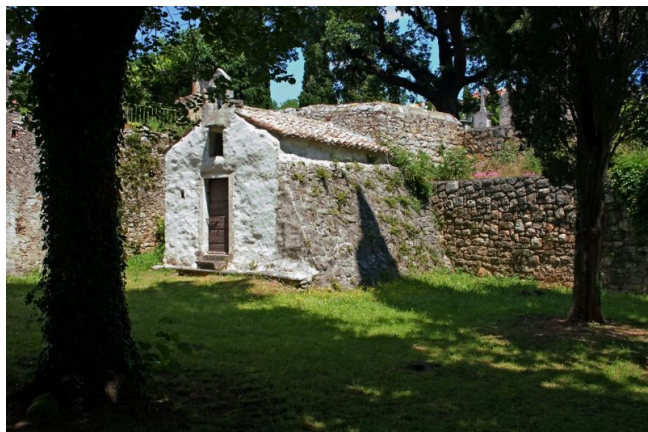
Slika br. 6 – Kapela svete Katarine