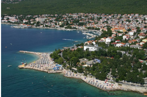
Slika br. 1 – Panorama Selca