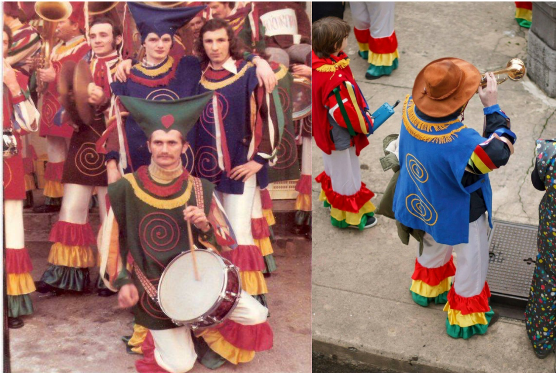
Slika br. 12 – Selačka mantinjada u prošlosti i danas