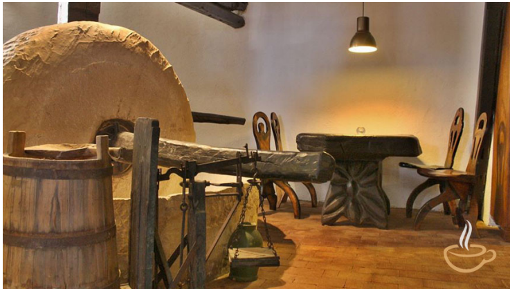
Slika br. 8 – Toč, mlin za masline