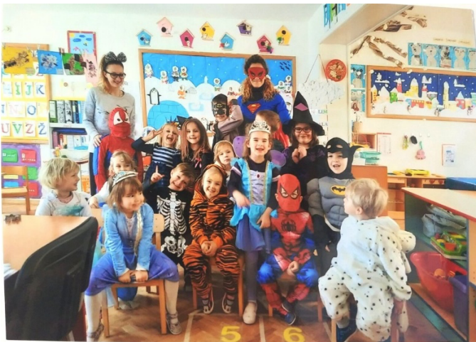
Slika br. 18 – Djeca u maškaranom centru