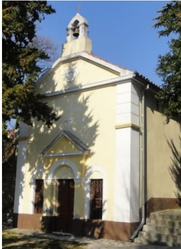
Slika br.7 – Kapela svetog Josipa