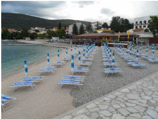
Slika br. 4 – Plaža Rokan u Selcu