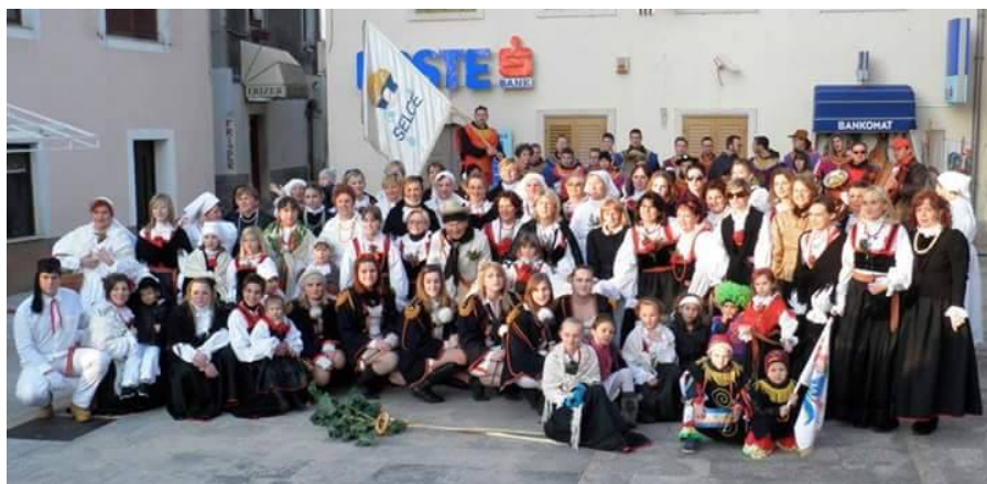
Slika br. 14 – Selačka mantinjada s mažoretkinjama i narodnim nošnjama