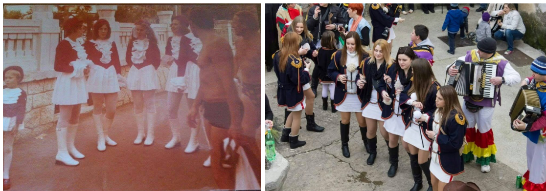
Slika br. 13 – Selačke mažoretkinje u prošlosti i danas