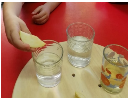
Slika 3. Pokus s jabukom ( https://djecjivrticmedenjak.hr/mjesecno-izvjesce-listopad-2021/ preuzeto 22.8.2024.).

Objašnjenje: Uzorak jabuke koji je bio izložen zraku brzo je potamnio zbog oksidacije. Oksidacija je kemijski proces pri kojem kisik reagira s atomima. Oksidacija je gubitak elektrona u elementu ili molekuli do koje dolazi pri kontaktu s kisikom iz okoline. Do toga dolazi zato jer se unutar jabuke nalazi enzim koji se naziva polifenoloksidaza (PPO) ili fenolaza. Smeđa boja koju jabuka poprima je rezultat pretvaranja fenola u melanin pri utjecaju kisika.