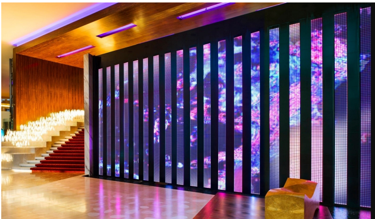
Slika 3. Pametni zidni zaslon i rasvjeta u hotelu