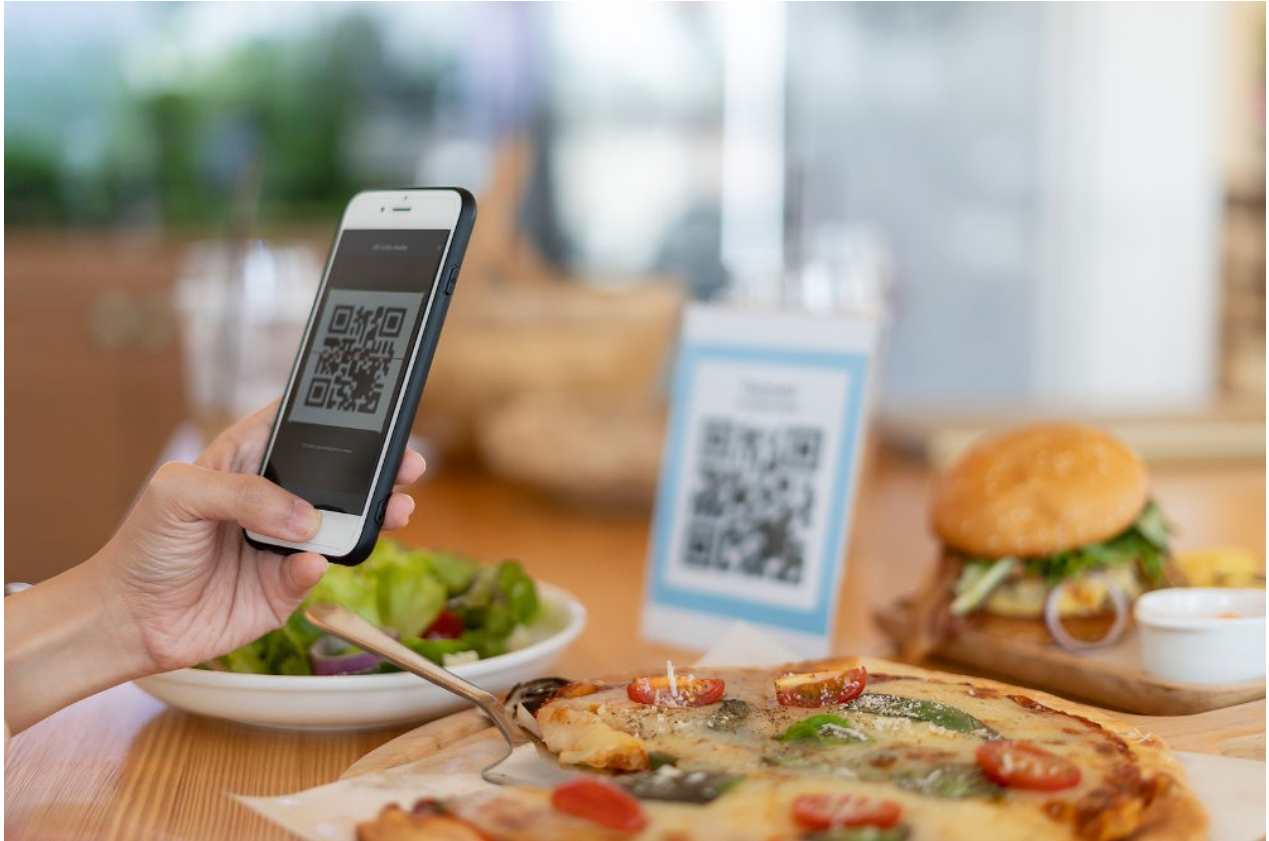
Slika 4. Digitalna narudžba u hotelu Urban Elegance u Thessalonikiju