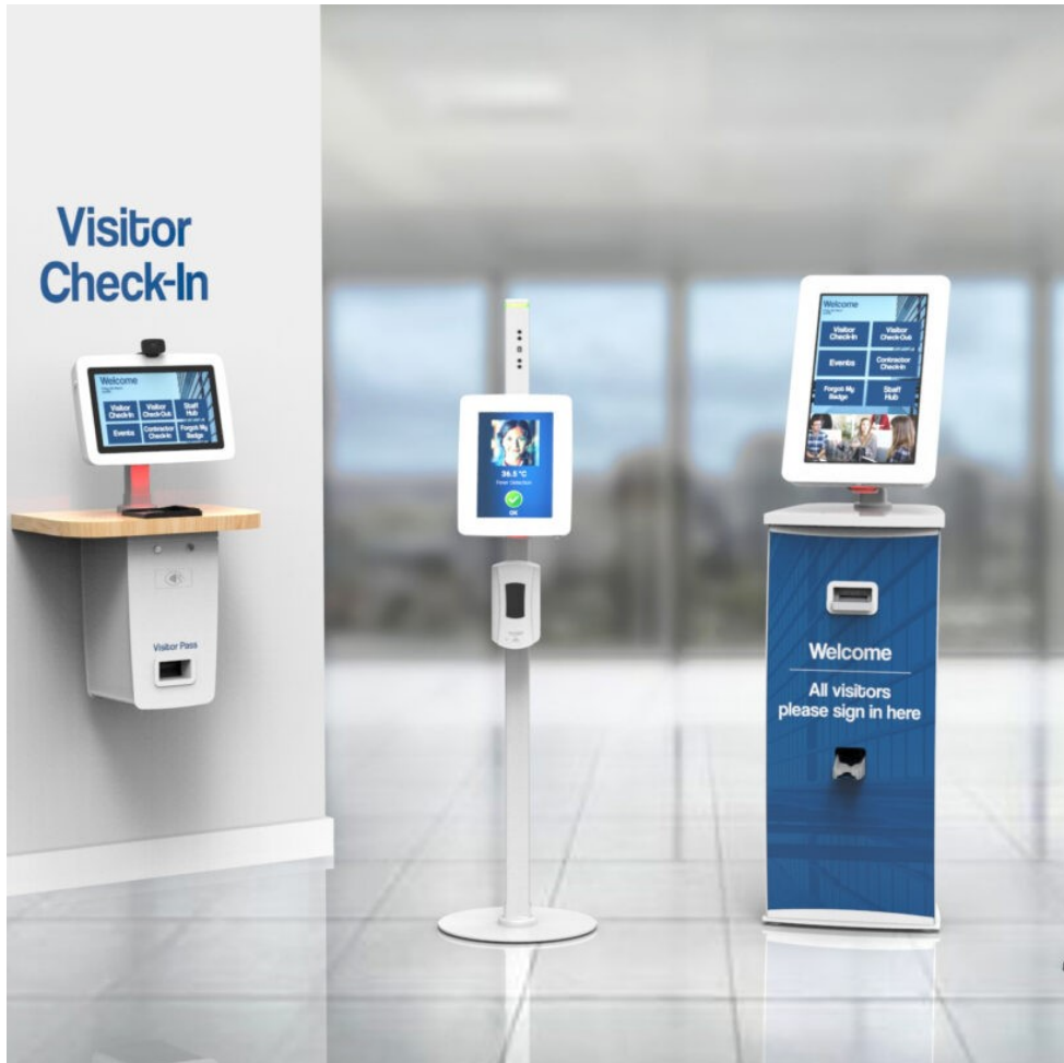
Slika 1. Digitalni check in/check out u hotelima