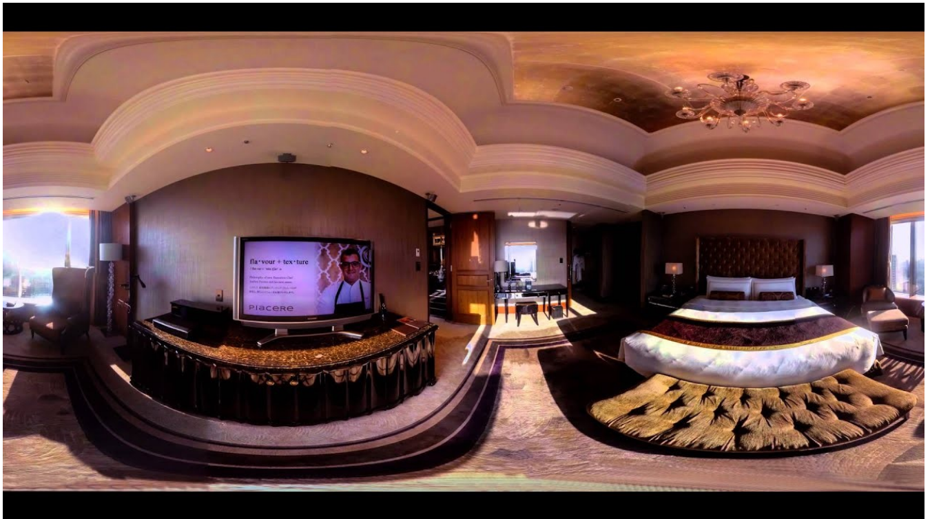
Slika 5. Virtualna tura predvorjem hotela Holiday Inn Express Sydney