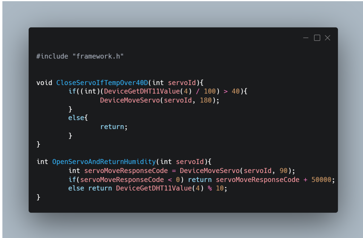
Slika 11 - Kod spremnika koji omogućuje jednostavne funkcije mijenjanja pozicije servo motora ovisno o temperaturi

komunikacija s web aplikacijama, mrežnim servisima te ostalim uređajima dostupnima u mreži.