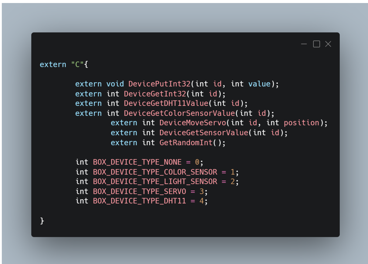
Slika 7 - Prikaz zaglavlja radnog okvira

Postavljanjem spremnika, na mikrokontrolere, na načinima navedenim u poglavlju 3.8., moguće je poslati naredbu pojedinom spremniku. Prije nego što pokrenemo spremnik moramo saznati koji je njegov id te koje funkcije sadrži. Pozivom na adresu servera, koji je pokrenut na mikrokontroleru, možemo pronaći sve željene podatke o sveukupnom sadržaju dostupnih spremnika u mikrokontroleru dok, uz pomoć druge putanje, možemo dobiti i detaljne informacije o pojedinom spremniku. Slika 8 prikazuje odgovor na upit za dohvat podataka o sveukupnom popisu spremnika na mikrokontroleru no dostupna je i putanja koja vraća odgovor o detaljima određenog spremnika.