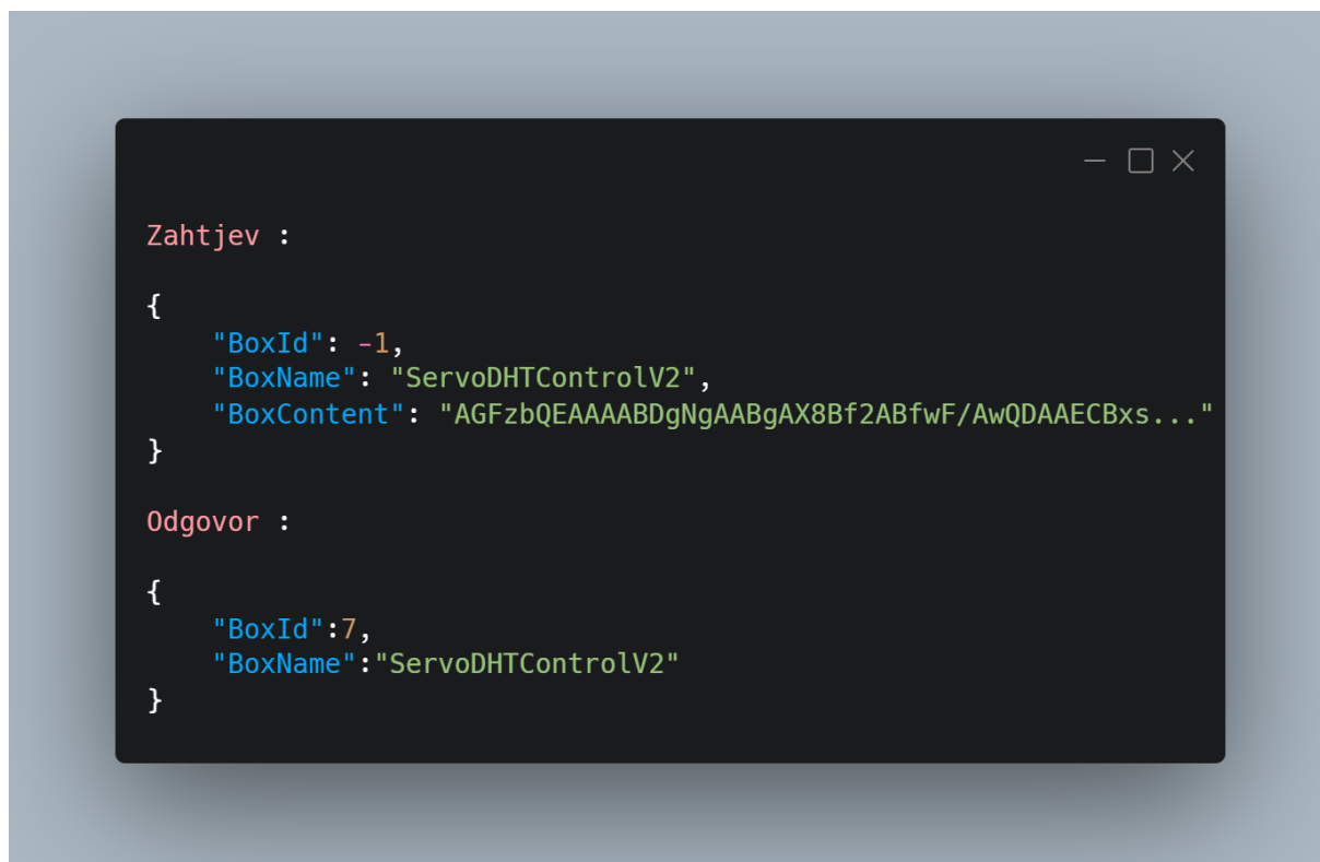
Slika 9 - Primjer zahtjeva za postavljanje novog spremnika (Box) te odgovor s dodijeljenom oznakom

Ovom primjeru je cilj pokazati kako se može spremnik ažurirati putem mrežnog sučelja, bez gašenja uređaja, te time promijeniti logiku upravljanja servo motorima i dohvata podataka o temperaturi i vlažnosti zraka. Hardver se sastoji od DHT11 [35] senzora za temperaturu i vlažnost zraka te 2 servo motora [36] koja su povezana s mikrokontrolerom. Unutar zaglavlja radnog okvira dodane su funkcije koje apstrahiraju rad s senzorom i servo motorom dok su unutar radnog okvira te funkcije implementirane i dodane u popis funkcija koje se povezuju kad se inicijalizira spremnik. Uređajima se pristupa na način da parametri funkcija sadrže id koji je definiran u samom mikrokontroleru, time se može koristiti jedna funkcija za mijenjanje ili primanje stanja više istih uređaja. U ovom primjeru servo A ima id 34 a servo B ima id 35 dok senzor temperature i vlažnosti zraka ima id 31, dakle svaki uređaj ima svoj jedinstveni id pomoću kojeg ga se može adresirati te pozivati njegove funkcije dostupne u zaglavlju radnog okvira prikazanog u slici 7. Sadržaj HTTP Post naredbe za izvršavanje funkcije na servo motoru s oznakom 34 je prikazan u slici 10.