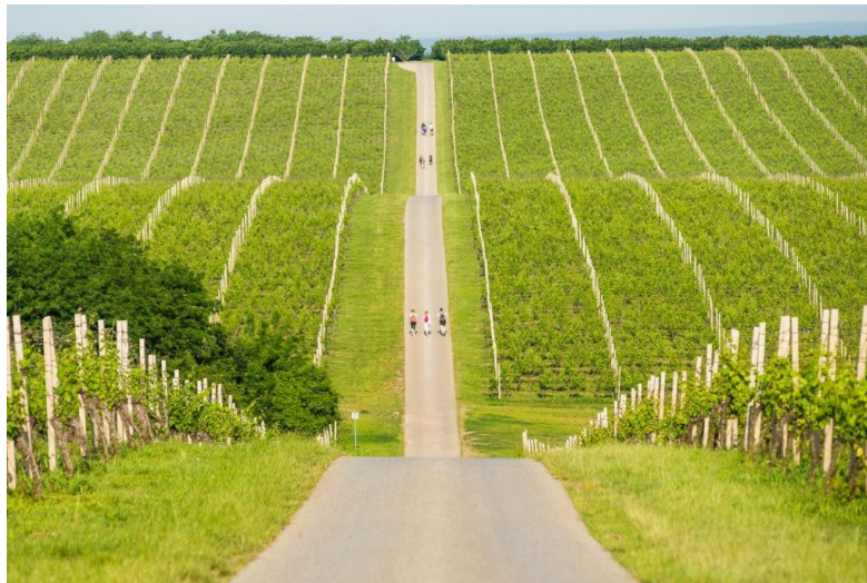
Slika 5: Vinska cesta Banovo brdo

Vinska cesta Banovo brdo nalazi se na Karanačkom brdu te se s uređenog vidikovca na visini od 230 m pruža prostran pogled na vinograd vinarije Belje. Cesta je duga gotovo osam kilometara (Slika 5).