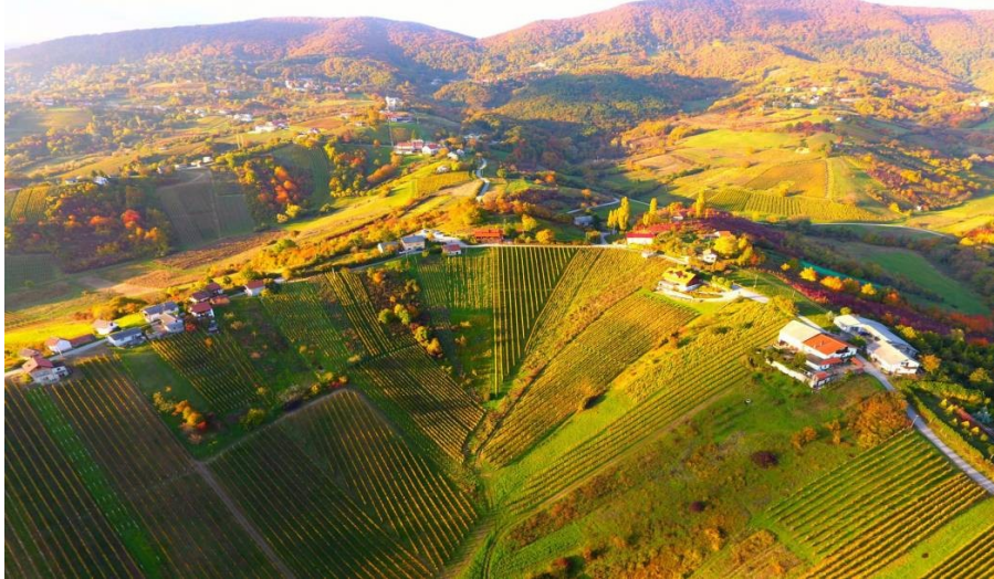
Slika 4: Vinska cesta Plešivice

Vinska cesta Plešivice nalazi se u vinskoj regiji Bregovita Hrvatska (Slika 4). Sastoji se od četrdesetak vinara.