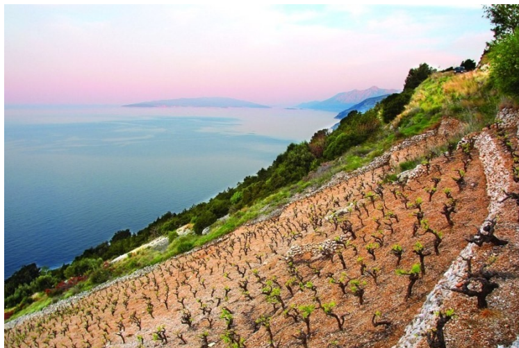
Slika 3: Vinska cesta Pelješac

Vinska cesta Pelješac nalazi se u vinskoj regiji Dalmacija. Karakteristična je po tome što je teren vrlo nepristupačan i strm (Slika 3).