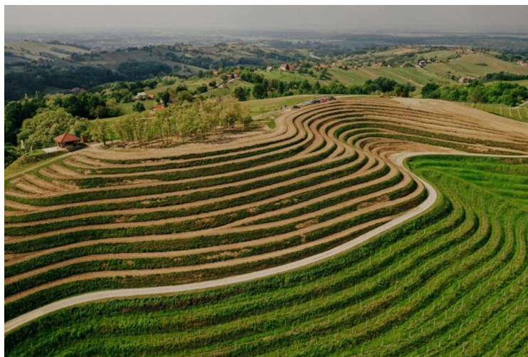
Slika 2: Mađerkin breg kod Štrigove

Moslavačka vinska cesta nalazi se u vinskoj regiji Bregovita Hrvatska. Proteže se od Popovače preko Volodera pa sve do Kutine i okolice. Na Moslavačkoj gori razvile su se tri sorte grožđa moslavac, dišeća ranina (belina) i škret ( turizam-kutina.hr ). Vinogradi su pravljani tako da rade razne zanimljive reljefne oblike (Slika 2).