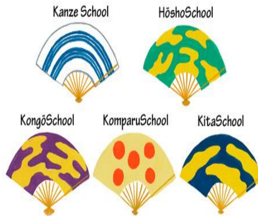
Slika 8. Tradicionalne lepeze korištene u predstavama nōa