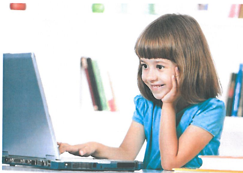
Slika 3. Dijete i računalo

Ne možemo točno utvrditi i složiti se time da li je računalo potrebno predškolskom djetetu. S jedne strane, kod djeteta možemo razviti pozitivne vještine koje će mu pomoći u usvajanju školskih obaveza, dok će s druge strane isto to dijete zanemariti sve one tjelesne aktivnosti za koje je normalno da ih obavlja u predškolskoj dobi, naravno ukoliko je uporaba računala učestala. U današnje vrijeme, predškolska djeca okružena su raznim modernim uređajima kao što su mobiteli, tableti, računala koji su im maksimalno dozvoljeni od strane roditelja. Nažalost, sve je manje djece po igralištima i općenito u prirodi. Slobodno možemo reći da je moderna generacija prevladala i da je djeci u današnje vrijeme pretjerano dopušteno. Upravo radi toga, djeca se sve manje bave tjelesnom aktivnošću i u druženju sa svojim vršnjacima.