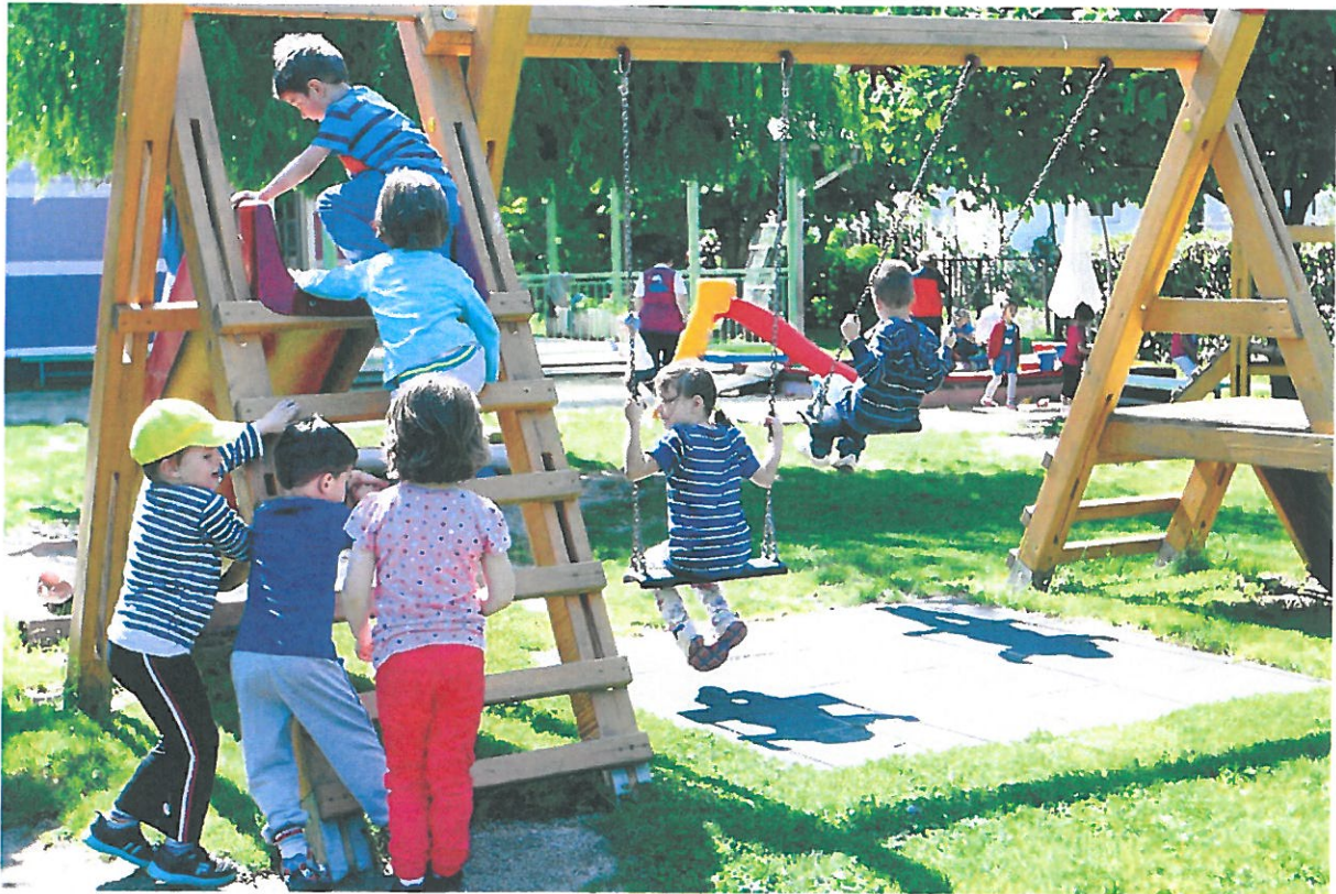
Slika 2. Spontano vježbanje

Tjelovježbu prije svega treba se prilagoditi dječjoj dobi jer njihova tijela nisu u potpunosti razvijena. Stoga nije dobro opterećivati dijete dugim i napornim tjelovježbama. Svako predškolsko dijete zna koliko može i hoće, stoga nije bitno forsirati dijete na obavljanje takvih aktivnosti, već obavljati onoliko koliko je u planu rada zapisano i koliko se od djeteta očekuje obzirom na njegovu dob.