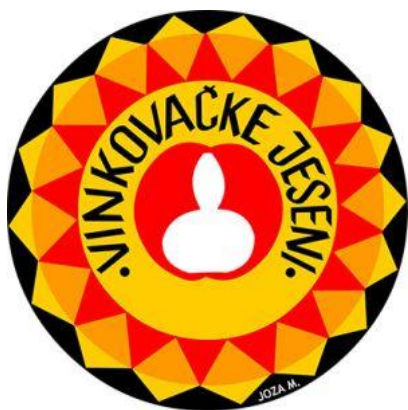
Slika 7. Grb Vinkovačke Jeseni