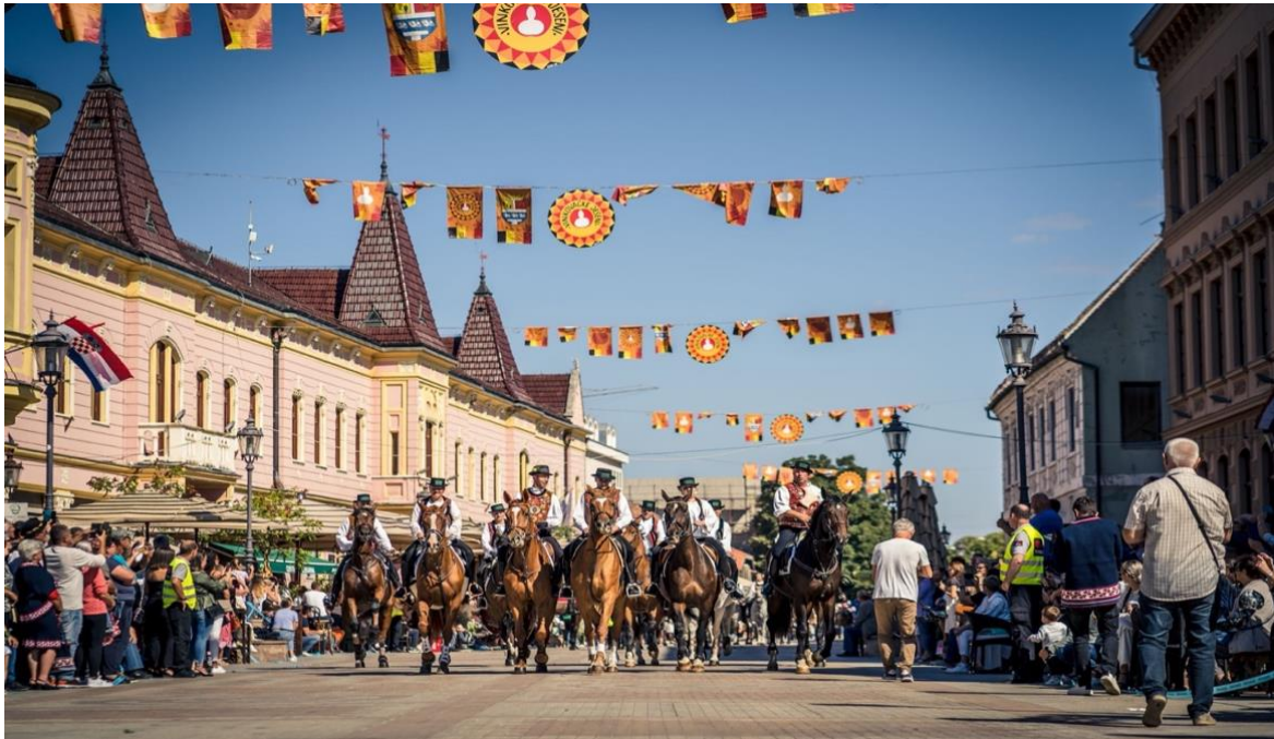
Slika 8. Vinkovačke jeseni