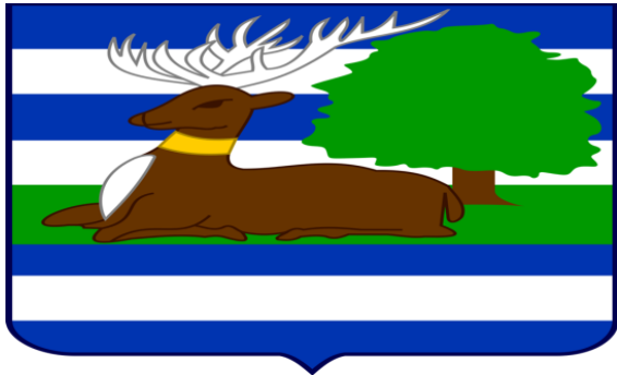
Slika 2. Grb Vukovarsko - srijemske županije