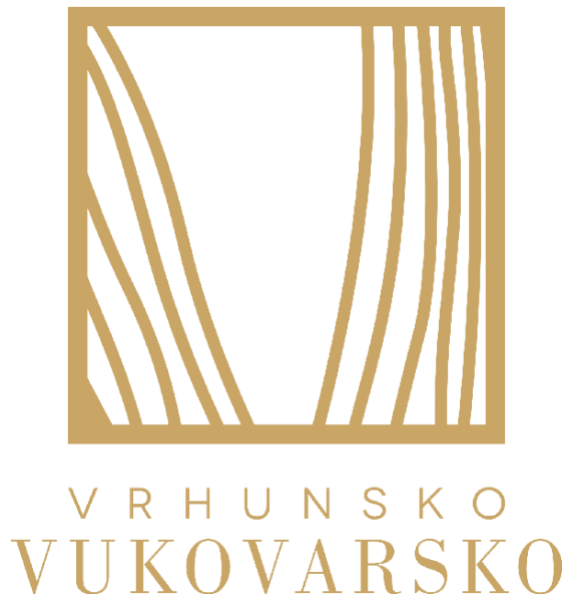
Slika 5. Logo brenda "Vrhunsko Vukovarsko"