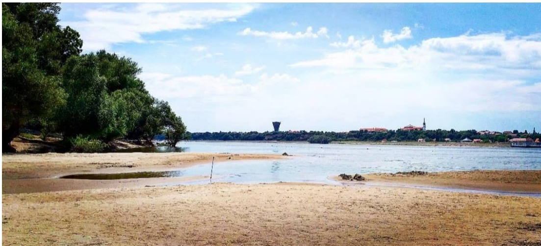
Slika 6. Vukovarska Ada