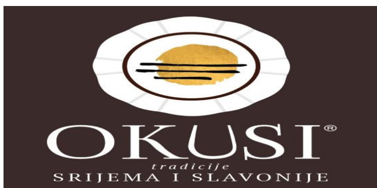
Slika 3. Simbol projekta "Okusi Srijema i Slavonije"