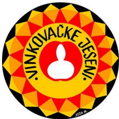
Slika 7. Grb Vinkovačke Jeseni