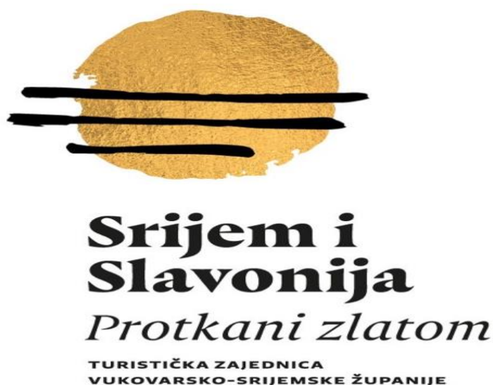
Slika 4. Logo Turističke zajednice Vukovarsko - srijemske županije