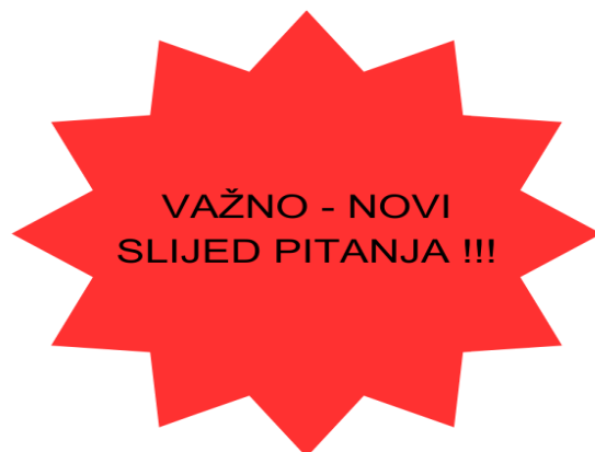
Slika 6. Vizualno upozorenje novog slijeda pitanja