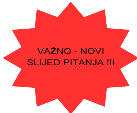
Slika 8. Vizualno upozorenje novog slijeda pitanja