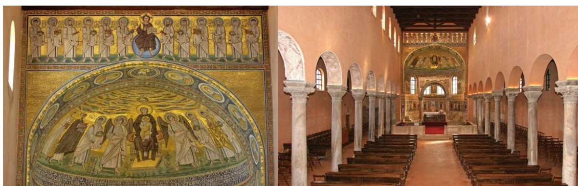
Slika 1. Eufrazijeva bazilika u Poreču