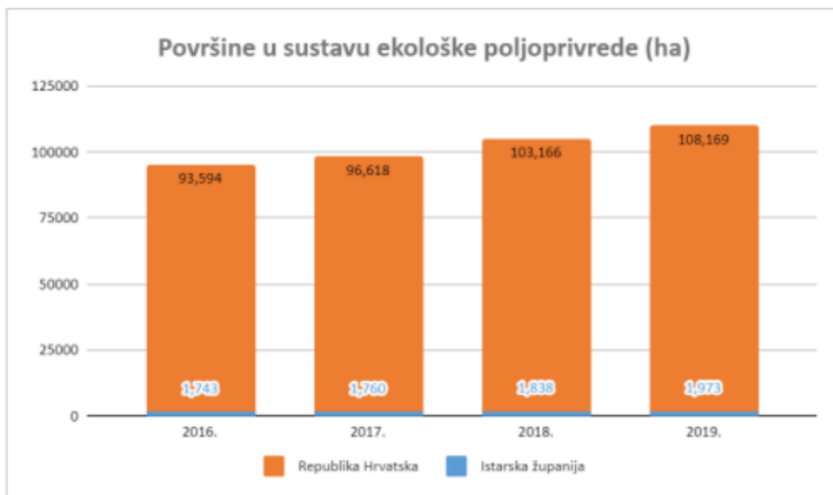
Grafikon 1. Poljoprivredne površine u Istri pod ekološkom proizvodnjom