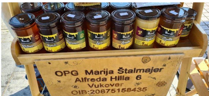
Slika 3. Med kao domaći proizvod OPG – a Štalajmer MED