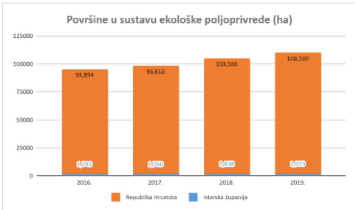
Grafikon 1. Poljoprivredne površine u Istri pod ekološkom proizvodnjom

Izvor: Regionalna agencija AURORA (2021): Plan razvoja Istarske županije za razdoblje 2022.-2027. – analiza stanja, dostupno na https://www.istra-istria.hr/media/filer_public/8e/80/8e80157e-c454-4217-b2c1-c6e592c64a92/240206_stanje_plana_2022-2027.pdf , str. 128, (pristupljeno 02.03.2024.)