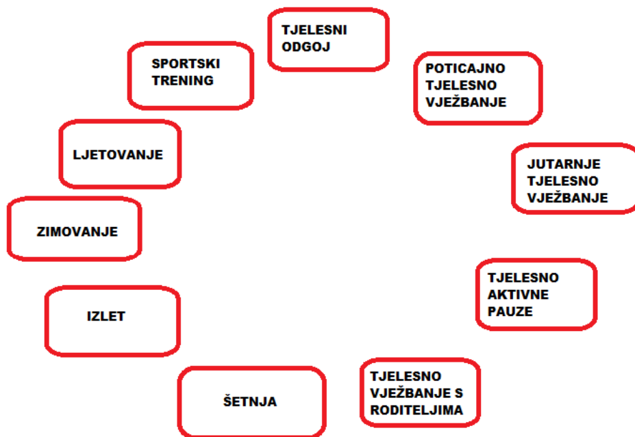
Slika 1. Vrste kinezioloških aktivnosti za djecu rane i predškolske dobi (Petrić, 2019)

Kineziološke aktivnosti u ranom i predškolskom odgoju i obrazovanju predstavljaju različite vrste tjelesnog vježbanja za djecu rane i predškolske dobi koje proizlaze iz znanstvenih i stručnih spoznaja kineziološke metodike. Njihova je svrha osigurati motoričku pismenost djece kako bi se omogućio efikasan, cjelovit i planski utjecaj na njihovu motoriku i optimalan razvoj antropoloških obilježja (Petrić, 2019)