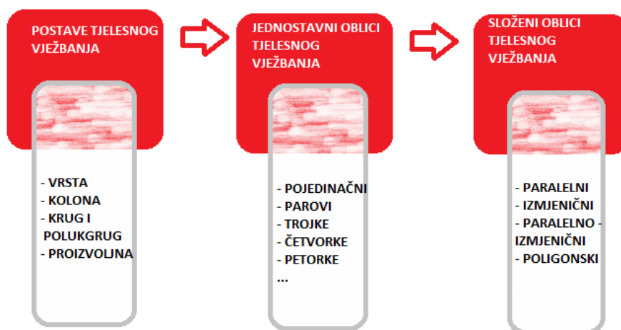
Slika 2. Organizacijske postavbe i oblici tjelesnog vježbanja za djecu rane i predškolske dobi (Petrić 2019; modificirano prema Neljak, 2011)