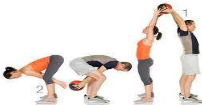
Slika 9. Primjer vježbanja s medicinkom u organizacijskom obliku parova ( https://www.xplorerlife.hr/blog/vjezbe_u_paru_medicinka/ )

Kod rada u trojkama i četvorkama djeca istodobno obavljaju istu vježbu u grupama od troje ili četvero, uz prethodno odgojiteljevo objašnjenje i demonstraciju. Formiranje ovih grupa ovisi o vrsti vježbe i cilju koji se želi postići.