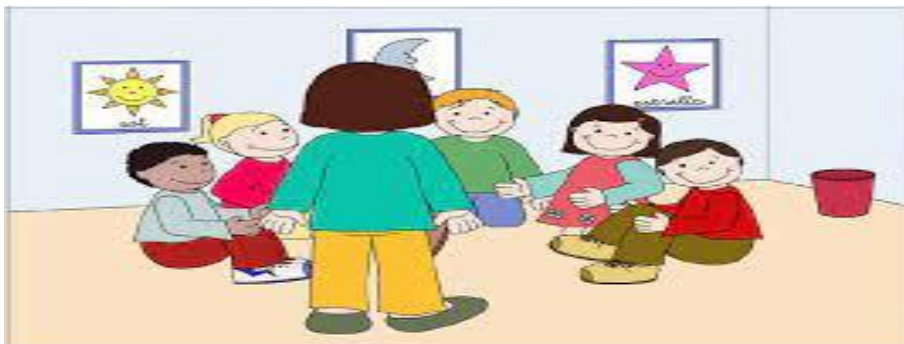
Slika 6. Djeca u postavi polukruga