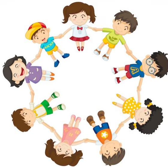
Slika 5. Djeca u postavi kruga