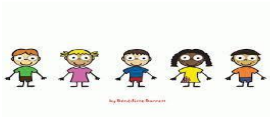
Slika 3. Vrsta kao organizacijska postava tjelesnog vježbanja.

Kolona je sljedeći oblik organizacijske postave u kojem su djeca postavljena tako da se nalaze jedan iza drugoga. Koristi se u svrhu hodanja, trčanja, čekanja na red kod određenih motoričkih zadataka. Nadalje, postoji postava kruga/polukruga koja se koristi kod zajedničkih igara ili dječjih plesova.