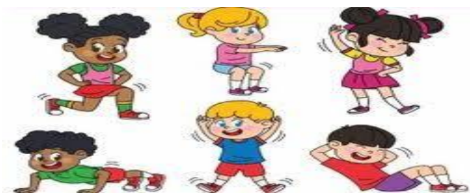
Slika 8. Djeca u pojedinačnom obliku tjelesnog vježbanja

skupini pojedinačno (samostalno), bez neposredne suradnje s drugim djetetom. Raspoređivanje djece u pojedinačnoj postavi vježbanja ovisi o obilježjima strukture motoričkog zadatka koji se provodi. Sukladno tome, položaj djeteta u odnosu na odgojitelja, spravu, pomagalo ili drugo dijete može biti: čeon, bočni, polubočni, proizvoljni ili okrenut leđima. Ovaj oblik gotovo i ne posjeduje pasivno vrijeme, što je iznimno bitno za zadržavanje koncentracije djece i efektivno tjelesno vježbanje. Pojedinačna postava pospješuje razvoj antropoloških obilježja djece i kvalitetnije usavršavanje motoričkih sadržaja. Primjena pojedinačne postave moguća je u svim dijelovima aktivnosti te bi ju odgojitelj trebao primjenjivati kada mu god to izabrani motorički sadržaji i materijalni uvjeti rada to omogućuju.