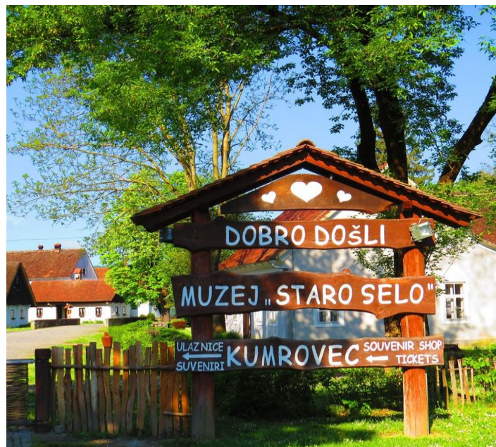
Slika 6. Muzej Staro selo Kumrovec

Kada se govori o razvoju Muzeja Staro selo tada se govori o davnoj 1947., kada su narodi iz svih bivših krajeva Jugoslavije htjeli posjetiti Kumrovec radi razgledavanja rodne kuće Josipa Broza Tita. U to vrijeme predstavila se ideja da se jezgra Kumrovca obuhvati mjerama spomeničke zaštite te je te godine Urbanistički institut NR Hrvatske izradio osebujan plan prostora i u tu je svrhu prof. Marijana Gušić, koja je tada bila direktorica Etnografskog muzeja u Zagrebu, napisala studiju o Kumrovcu. 47 Tada se mogao primijetiti nagli razvoj Kumrovca.