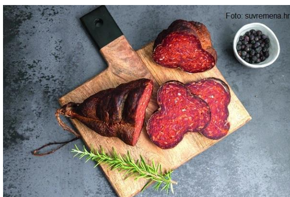
Slika 7. Kulen

Među tradicionalnim suhomesnatim proizvodima od svinjskog mesa sa područja Slavonije ističe se kulen kao najkvalitetniji proizvod te kao proizvod koji najbolje predstavlja ovu regiju. Izvorni je slavonski mesni proizvod „sporo fermentirajuća trajna kobasica proizvedena iz mješavine najkvalitetnijeg svinjskog mesa, kuhinjske soli, ljute i slatke crvene začinske paprike i češnjaka, nadjevena u svinjsko slijepo crijevo“. Slavonski kulen je sastavni dio tradicije, prehrambene kulture te načina življenja u regiji Slavoniji. Od ostalih suhomesnatih proizvoda izdvajaju se i kobasice, krvavice, čvarci, švargle i dr. 41