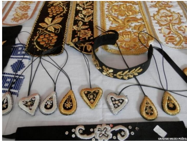
Slika 6. Zlatovez

Zlatovez je tehnika veza u kojoj se veze zlatnim koncem. Dolazi u dvije boje: zlato i bijelo zlato. Odražava barokni te rokoko utjecaj na tradicionalno odijevanje u Slavoniji i Baranji s vremenskim odmakom (traje sve do 19. stoljeća). Utjecaj građanskog odijevanja na tradicionalno ogleda se u napuštanju vunениh tkanina koje sve brže zamjenjuju industrijski materijali poput svile, brokata i posebno samta. Svila i samt postaju podlogom za zlatovez, koji se veze preko papira radi boljeg isticanja. Zlatovezom se, osim ukrašavanja odjeće, izrađivao i nakit, često u kombinaciji s povezanim dukatima. 40