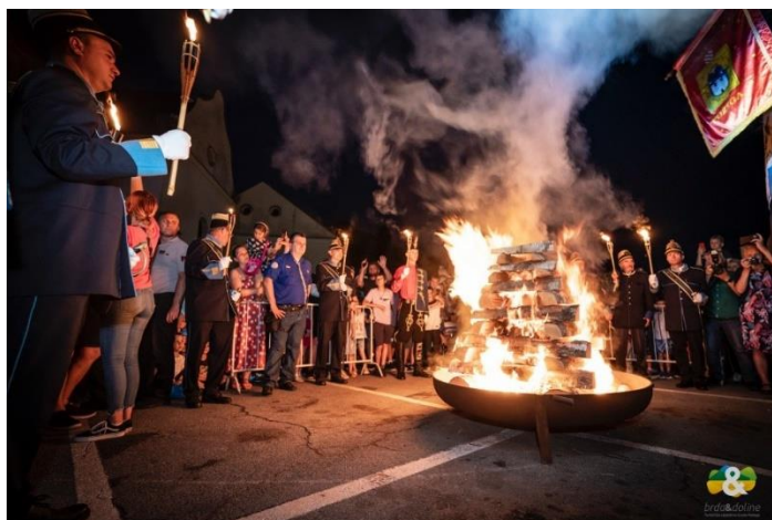
Slika 11. Paljenje ivanjskog krijesa