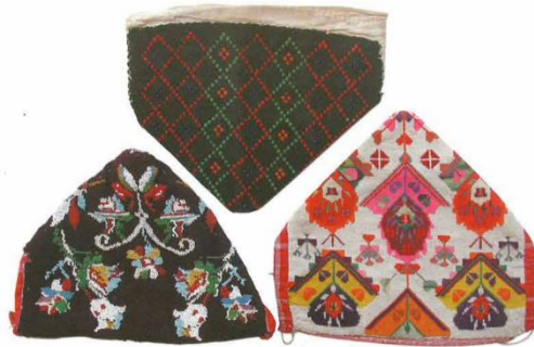
Slika 3. Poculice – žensko pokrivalo za glavu

Svakodnevne poculice bile su izrađene od crvenog kariranog tkanja, poznatog kao jaglučanac, dok su svečanije poculice bile izrađene od kupovne tkanine, gusto izvezene i ukrašene križićima i đerdanima. Poculice su dolazile u crnoj, crvenoj i zelenoj boji, s raznobojnim ukrasima. Obično su bile izvezene vunom, dok su svečane verzije bile od pliša, ukrašene vunom i staklenim perlicama.