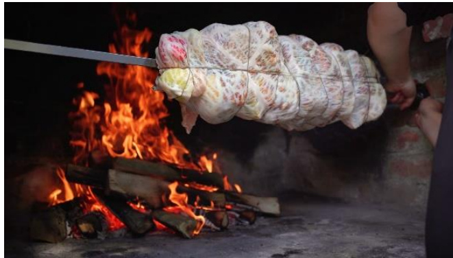
Slika 18. Vinogradarski ćevap

Danas je vinogradarski ćevap ponovno postao neizostavna delicija koja se priprema prilikom obilježavanja Grgureva, vraćajući se u središte požeške kulinarske tradicije. 63