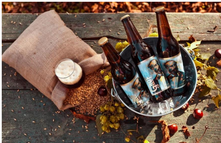
Slika 9. Poznato pivo „Grof“ pivovare Slavonica

Danas je Požeško-slavonska županija među pivoljupcima poznata još i po maloj obiteljskoj pivovari „Mbc“, craft pivovari „Seven Bridges Brewery“, pivovari „Slavonica“ u Pakracu, pivovara „Franz“ u Pleternici i pivovari „Felix Machina Brewery“ u Brestovcu. 45