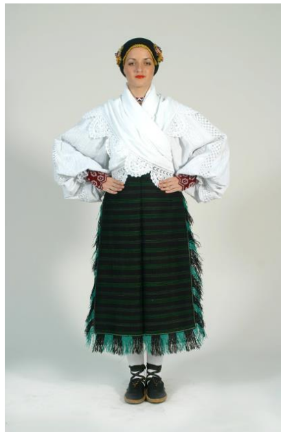
Slika 2. Ženska nošnja Požeške kotline

Gunjce su vunene marame ili kudmene (kožusi obloženi krznom) koje su žene nosile zimi umjesto kaputa. Od prve polovice 20. stoljeća, mlađe žene počele su nositi plišane kapute. 36