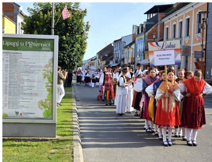
Slika 13. Povorka folklornih skupina

Treći vikend lipnja obilježen je konjičkim turnirom koji uključuje utrke, utakmice i dresurne vožnje, a također nudi raznovrsne sadržaje za obitelji, djecu, udruge i posjetitelje željne zabave. Manifestacije poput Knjignika - piknika uz knjigu, sajma udruga i gospodarstvenika čine finale lipnja, pružajući priliku za okupljanje, zajedništvo i druženje. 54