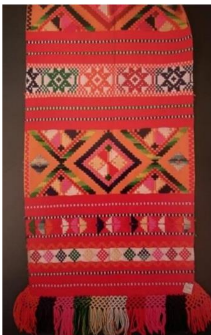
Slika 1. Svečani peškir

Peškiri (ručnici) predstavljaju još jedan primjer bogatstva tradicionalnog tkanja i veza u požeškom kraju. U svakodnevnoj upotrebi, jednostavno su se ukrašavali uzdužnim tkanjem ili debljim prugama u crvenoj ili tamnoplavoj boji, a na krajevima su imali izvezenu kukičanu čipku. Ručnici koji su se koristili za svečane prilike, poput svadbi, Uskrsa i drugih običaja, bili su bogato ukrašeni ornamentima. Često su bili crvene boje, s plošnim vezom, vunenim biljnim ili geometrijskim motivima te resama. 34