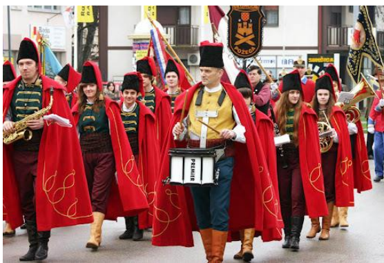
Slika 17. Grgurevo