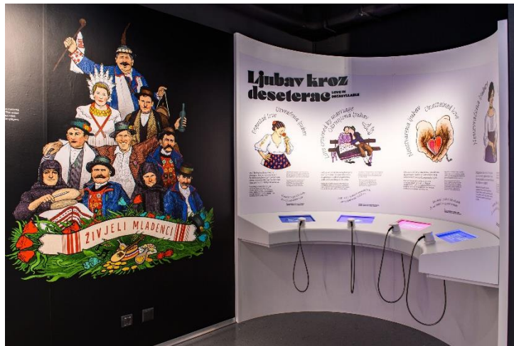
Slika 10. Muzej bećarca u Pleternici

Grad Pleternica ponosi se Muzejom bećarca, koji je posvećen očuvanju i promicanju ovog značajnog kulturnog fenomena. Muzej bećarca u Pleternici predstavlja interaktivno iskustvo gdje posjetitelji mogu saznati više o povijesti, razvoju i značenju bećarca te njegovoj ulozi u slavonskoj tradiciji. Kroz raznolike izložbe, multimedijalne sadržaje i edukativne programe, muzej oživljava duh bećarca, čineći ga dostupnim i razumljivim svim generacijama. 48