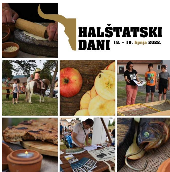
Slika 16. Festival starijeg željeznog doba u Zlatnoj dolini

Tijekom manifestacije organiziraju se povijesni performansi i rekonstrukcije bitki, ceremonija i običaja iz halštatskog doba. Ovo daje posjetiteljima priliku da vide kako su izgledali rituali i svakodnevni život ljudi iz tog vremena. Održavaju se nastupi tradicionalne glazbe i plesa, često izvedeni u kostimima koji odgovaraju halštatskom razdoblju, kako bi se dočarao duh vremena, a za najmlađe se organiziraju razne edukativne i kreativne radionice. 60