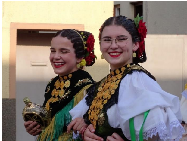
Slika 4. Prepoznatljiva slavonska frizura i dukati

Djevojke i mlade žene kitile su se oko vrata trakom od crnog samta na kojoj su bili prišiveni dukati ili medaljice. Nosile su također i đerdane, staklene obojane perle koje su padale preko prsa ili bile spletene kao čipka. Ukrašavale su se grančicama svježeg ili umjetnog cvijeća, a ispod povezače stavljale su roke (čipkaste upletene strune od konjskog repa) preko čela, dok su kovrče stavljale iza uha. Na rukama su nosile narukvice od crne ili crvene vune s upletenim bijelim perlicama.