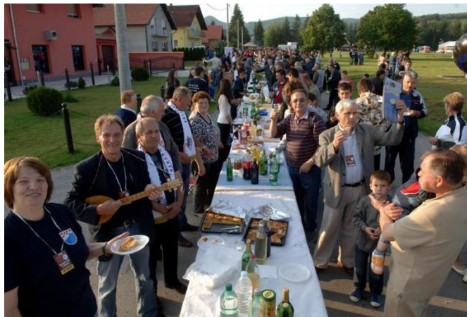
Slika 15. Najduži stol u Velikoj

Oko stola postavljeni su štandovi i kućice koje predstavljaju obiteljska poljoprivredna gospodarstva, vinare i proizvođače domaćih proizvoda. Svaki izlagač nudi degustaciju svojih proizvoda i objašnjava proces proizvodnje, a događaj je često popraćen bogatim kulturno-zabavnim programom, uključujući folklorne nastupe, glazbu uživo i druge prigodne sadržaje. „Najduži stol u Hrvata“ postao je pravi sinonim za slavonsku gostoljubivost i dobru zabavu, privlačeći veliki broj posjetitelja i sudionika svake godine. 59