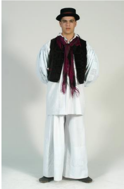
Slika 5. Muška nošnja Požeške kotline