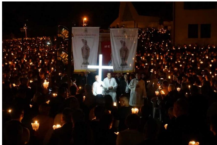
Slika 14. Posljednja večer devetnici Gospi od suza

Ova manifestacija kroz desetljeća nije izgubila na značaju, već je postala sve veća i važnija, s posebnim naglaskom na duhovnu obnovu i zajedništvo među vjernicima. Danas je Devetnica u Pleternici jedno od najvažnijih vjerskih događanja u regiji, čvrsto ukorijenjeno u tradiciji i vjerničkom životu Požeške-slavonske županije. 55