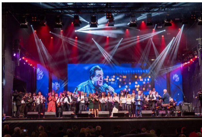
Slika 12. Zlatne žice Slavonije