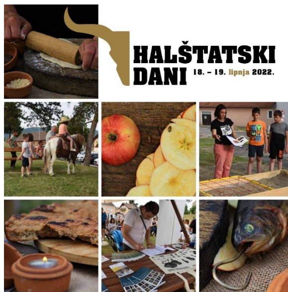
Slika 16. Festival starijeg željeznog doba u Zlatnoj dolini

Tijekom manifestacije organiziraju se povijesni performansi i rekonstrukcije bitki, ceremonija i običaja iz halštatskog doba. Ovo daje posjetiteljima priliku da vide kako su izgledali rituali i svakodnevni život ljudi iz tog vremena. Održavaju se nastupi tradicionalne glazbe i plesa, često izvedeni u kostimima koji odgovaraju halštatskom razdoblju, kako bi se dočarao duh vremena, a za najmlađe se organiziraju razne edukativne i kreativne radionice. 60