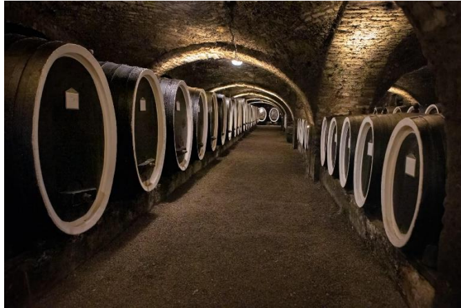
Slika 8. Kutjevački podrum