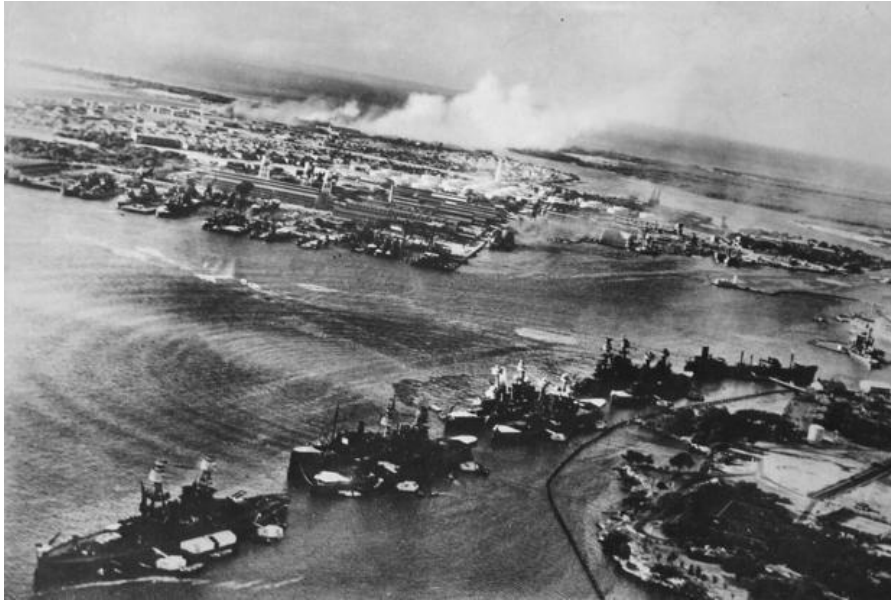
Slika 1. Napad na Pearl Harbor