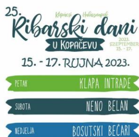
Slika 23. Ribarski dani u Kopačevu

Manifestacija Ribarski dani u Kopačevu traje po dva dana (vikend). Manifestacija se održava svake godine u rujnu (Turistička zajednica Općine Bilje, 2024). Kopačevo ovom manifestacijom promovira tradiciju i seoski turizam.