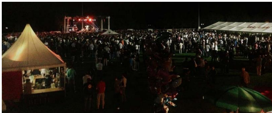
Slika 17. Gator Fest – Festival dobrog vina

Gator Fest manifestacija (prvobitno zvana Surduk Fest ) organizira se početkom lipnja već duži niz godina. Cilj manifestacije je promocija baranjskog vina i ugodnog načina življenja (Alilović, 2015: 115). Manifestacija se održava u vrijeme kada su vina odležana i zrela te kada još uvijek postoje značajne količine vina za konzumaciju.