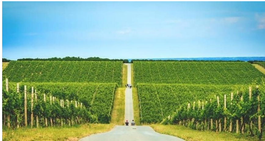
Slika 2. Banovo brdo

Banovo brdo (koje Baranjski često nazivaju i Banska kosa – istoimeno ime za radio stanicu u Belom Manastiru) brežuljkast je kraj prekriven vinogradima. S brda je vidljiv okolni krajolik (pogled na stotine hektara vinograda, šume, polja kukuruza, žita i uljane repice). Banovo brdo često je nazivano kao hrvatska Toskana . Brdo je popularno odredište za pješaćenje i biciklizam (Alilović, 2015: 109). Bansko brdo je mjesto gdje mnoge vinarije nude degustacije vina i vinske ture, čime se doprinosi promociji baranjskog enoturizma.