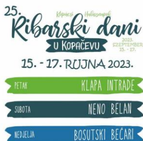
Slika 23. Ribarski dani u Kopačevu

Manifestacija Ribarski dani u Kopačevu traje po dva dana (vikend). Manifestacija se održava svake godine u rujnu (Turistička zajednica Općine Bilje, 2024). Kopačevo ovom manifestacijom promovira tradiciju i seoski turizam.