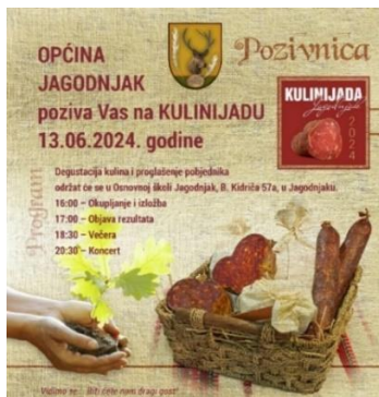
Slika 22. Kulenijada

Uz Festival kulena , ističe se Kulenijada . Za razliku od Festival kulena , koji je novija manifestacija, Kulenijada (nazivana i Kulinijada ) u Jagodnjaku organizira se već dugi niz godina (Agroklub, 2024). Dana 13. lipnja 2024. održana je 23. Kulenijada .