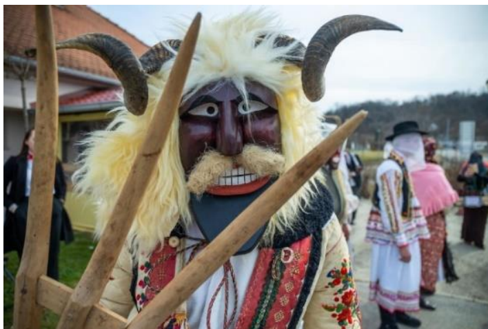
Slika 20. Baranjske buše