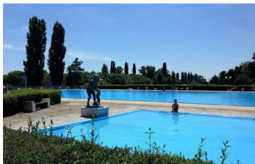
Slika 37. SRC Kneževi Vinogradi

U selu imaju još jedna vinarija Vina Alexander čiji se podrum nalazi u selu Kamencu. Vinarija je bila dobitnik brončane povelje u kategoriji vinskog turizma za nagradu Suncokret ruralnog turizma Hrvatske 2021 . Rakiju proizvode U.P.R.I.V. (Udruga proizvođača rakije iz voća) sa svojom Kneževom kušaonicom u industrijskoj zoni. SRC Kneževi Vinogradi je dovršen krajem 70-tih godina prošlog stoljeća i stalno se razvija, renovira i nadograđuje. SRC raspolaže olimpijskim bazenom (s velikim toboganom) i jednim manjim (mali tobogan) za djecu. Oba bazena renovirana su 2017. godine. Ovo je jedno od najposjećenijih mjesta tijekom ljetnih mjeseci i sezone kupanja. Iako, Osječani imaju svoju Kopiku (Copacabana) , njihovo najdraže mjesto za kupanje je ipak ovdje. Postoji kutak za djecu i veliko bure pretvoreno u ljetni šank gdje se prodaju pića i brza hrana poput langošica i pogačica s čvarcima. Tu se održavaju i škole plivanja, natjecanja u odbojci na pijesku, grupni posijeti ( teambuliding ) i druge aktivnosti na otvorenom (Alilović, 2015: 100). Mogu se iznajmiti i ležaljke. Na ulazu u SRC obično se nalaze manji štandovi gdje lokalno stanovništvo prodaje kuhani kukuruz, breskve, lubenice i sl. U sklopu SRC je i Restoran Panon sa širokom ponudom gastronomskih specijaliteta.