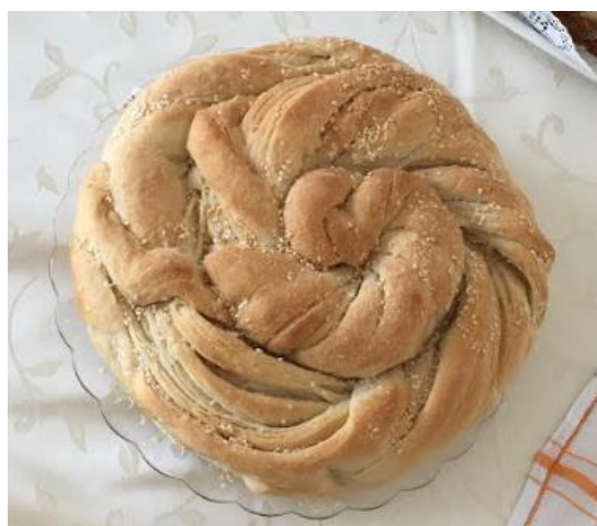
Slika 32. Pogača