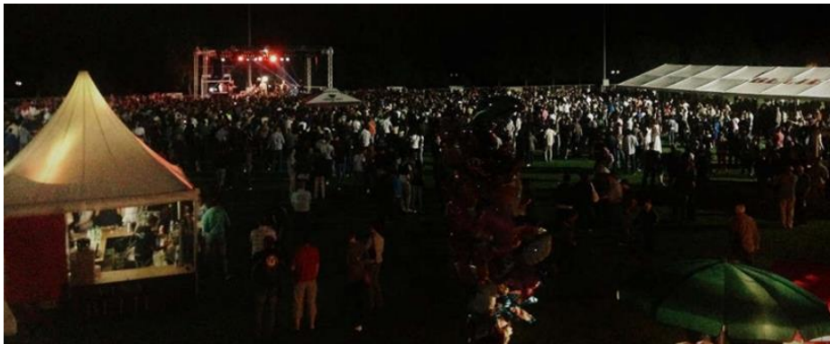
Slika 17. Gator Fest – Festival dobrog vina

Gator Fest manifestacija (prvobitno zvana Surduk Fest ) organizira se početkom lipnja već duži niz godina. Cilj manifestacije je promocija baranjskog vina i ugodnog načina življenja (Alilović, 2015: 115). Manifestacija se održava u vrijeme kada su vina odležana i zrela te kada još uvijek postoje značajne količine vina za konzumaciju.