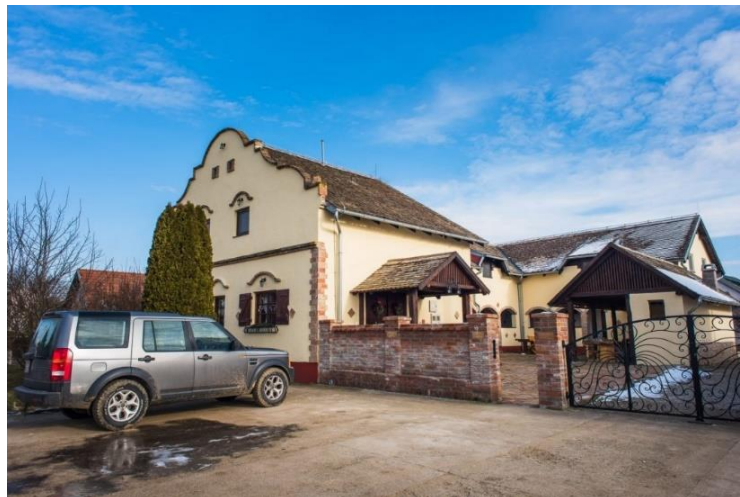
Slika 12. Seljačko domaćinstvo Villa Baranja

Villa Baranja renovirana je šokačko-švapska kuća izgrađena 1894. godine. Kuća ima sačuvan autentični etno stil. Ova kuća ima mogućnost za smjestiti tridesetak gostiju (Alilović, 2015: 111). Kuća se sastoji od 12 soba.