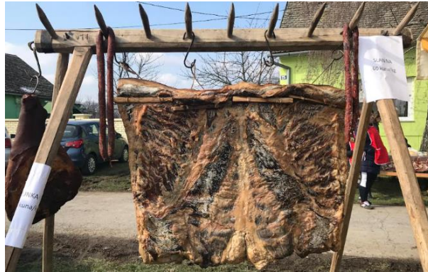
Slika 14. Princeza pušnice

Proljetni vašar u Karancu tradicionalno se organizira svake godine na Cvjetnicu. Na vašaru se mogu pronaći raznovrsni baranjski gastronomski specijaliteti i štandovi s domaćim suvenirima. Za dobru atmosferu budu zaduženi tamburaški sastavi.