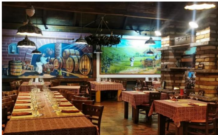
Slika 15. Vinarija Josić

2024). Za sve posjetitelje restorana organizira se besplatna degustacija vina u kušaonici. Prema željama posjetitelja mogu se organizirati i šetnje vinskim podrumima. Temperatura je u njima, u svako doba godine, idealna za vino (12 do 15 stupnjeva Celzijevih).