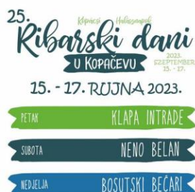
Slika 23. Ribarski dani u Kopačevu

Manifestacija Ribarski dani u Kopačevu traje po dva dana (vikend). Manifestacija se održava svake godine u rujnu (Turistička zajednica Općine Bilje, 2024). Kopačevo ovom manifestacijom promovira tradiciju i seoski turizam.