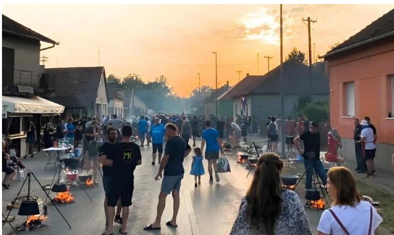
Slika 21. Najveća hrvatska fišijada

Početak rujna svake godine organizira se Najveća hrvatska fišijada . Manifestacija je podijeljena na dva dana ( Prvenstvo Hrvatske i Prvenstvo Baranje ).