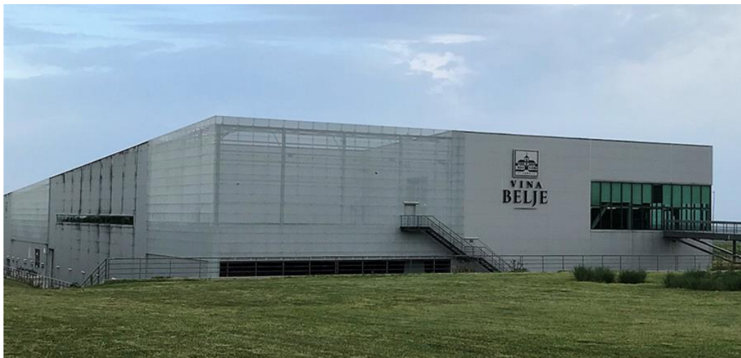
Slika 16. Vina Belje