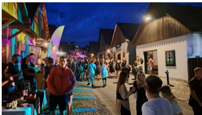
Slika 19. Vinski bor maraton Zmajevac

označene bojama, a maratonac starta na onoj vinskoj cesti ovisno o boji majice i čase koju dobije (zelena predstavlja najbliže podrume, žuta srednje udaljenje, a crvena najudaljenije).