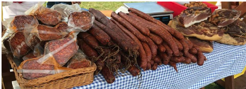
Slika 30. Suhomesnati proizvodi