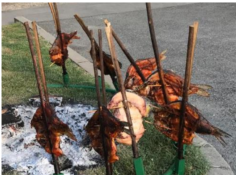
Slika 29. Šaran u rašljama