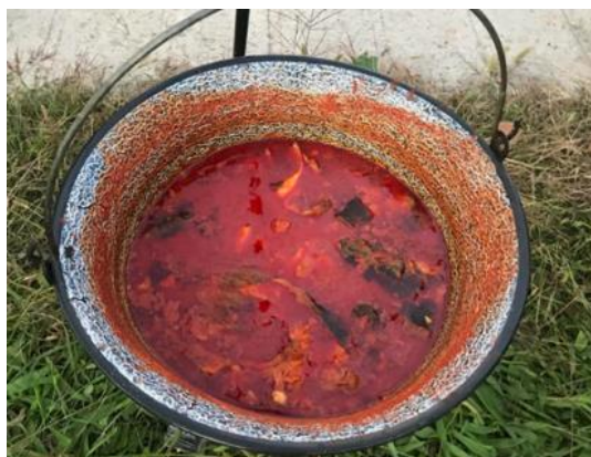
Slika 27. Fiš paprikaš