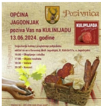
Slika 22. Kulenijada

Uz Festival kulena , ističe se Kulenijada . Za razliku od Festival kulena , koji je novija manifestacija, Kulenijada (nazivana i Kulinijada ) u Jagodnjaku organizira se već dugi niz godina (Agroklub, 2024). Dana 13. lipnja 2024. održana je 23. Kulenijada .