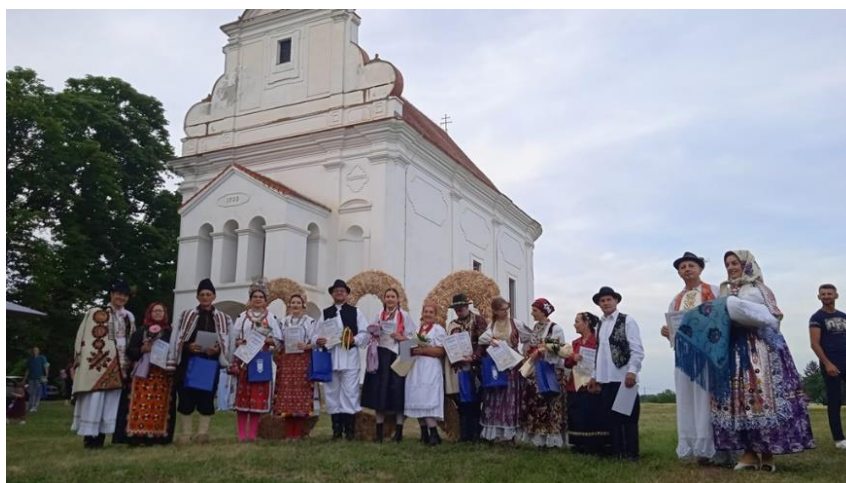
Slika 26. Baranjski bećarac

Program manifestacije počinje sa Šokačkim vašarom . Program je ispunjen plesom i pjesmama folklornih društava, posebice onih hrvatskih iz Baranje, Slavonije i Vojvodine (Srbija). Predstavljaju se i brojni oblici šokačke tjestenine kao što su trganci , taške , gomboce , rezanci i sl.