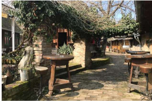
Slika 5. Ulica zaboravljenog vremena

mjesecima gostima je na raspolaganju prostrano dvorište preuređeno u terasu, gdje se jela poslužuju u sjenicama u hladu stabala oraha (kapacitet do 150 gostiju), a zimi u dvije sale (kapaciteta 60 i 70 osoba). U dvorištu se nalazi i dječje igralište. Etno restoran Baranjska kuća izabran je 2012. godine za najbolji restoran Osječko-baranjske županije, a 2013. godine uvršten je u top 100 restorana u Hrvatskoj.