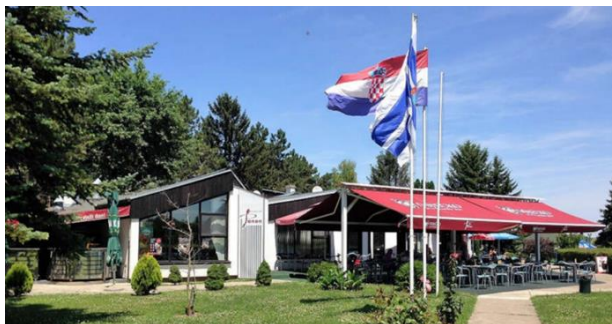
Slika 38. Restoran Panon

U sklopu restorana renovirana je (2017. g.) Svečana sala Iris . Sala je kapaciteta preko 200 sjedećih mjesta (Alilović, 2015: 100). I danas se tu održavaju svadbe, koncerti, proslave i zabave, dočeci Nove godine (prema Julijanskom i Gregorijanskom kalendaru), svečani objedi, likovne kolonije, predavanja i ostale manifestacije s različitim povodima. Ispred SRC-a nalazi se parking koji ima i pumpe za električna vozila. Uz Restoran Panon , u selu se nalazi Pizzeria Papica (danas zauzima i prostor nekadašnjeg popularnog kafića među mlađom generacijom – Caffe bar Cheers ), Caffe bar Bono te Pekarnica Edi .