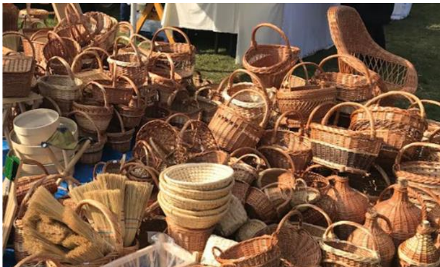
Slika 13. Zimski vašar

Neki od proizvoda koji se mogu pronaći su kulen , slanina, kobasica, šunka, čvarci, mast, vino, rakija, sokovi, sirevi, peciva, kolači, med, mljevena crvena paprika, pletene košare, drveni pribor za kuhinju, suveniri, antikviteti i dr. (Alilović, 2015: 111). Na vašaru mogu se kušati jela poput čobanca , graha iz glinenog ćupa, kotlovina, pečene kobasice, šaran u rašljama itd.