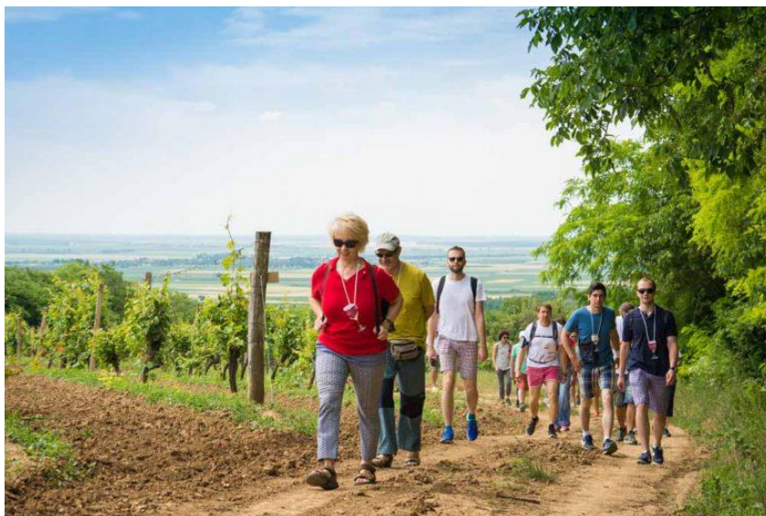
Slika 18. Baranja Wine & Walk

Događaj Baranja Wine & Walk održava se u lipnju svake godine. Na Banovom brdu se nalazi nekoliko točaka (vinari sa svojim štandovima) koje posjetitelji obilaze te degustiraju vina i odlaze na drugu točku ucrtanu na karti.