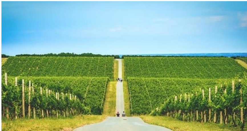
Slika 2. Banovo brdo

Banovo brdo (koje Baranjski često nazivaju i Banska kosa – istoimeno ime za radio stanicu u Belom Manastiru) brežuljkast je kraj prekriven vinogradima. S brda je vidljiv okolni krajolik (pogled na stotine hektara vinograda, šume, polja kukuruza, žita i uljane repice). Banovo brdo često je nazivano kao hrvatska Toskana . Brdo je popularno odredište za pješaćenje i biciklizam (Alilović, 2015: 109). Bansko brdo je mjesto gdje mnoge vinarije nude degustacije vina i vinske ture, čime se doprinosi promociji baranjskog enoturizma.