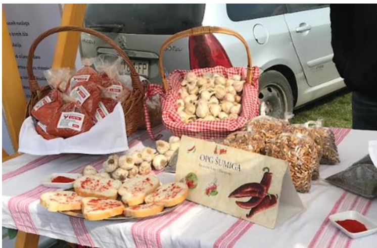
Slika 28. Mljevena paprika