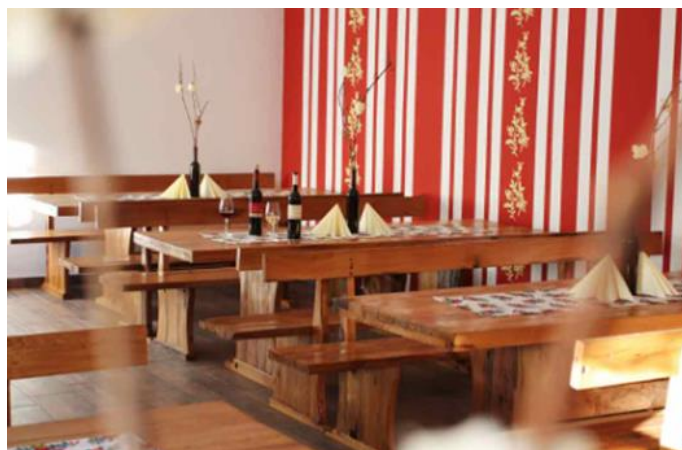
Slika 9. Obiteljsko podrum Szabó

Obitelj Szabó poznata je po vinogradarstvu i vinarstvu. Tradicija vinogradarstva u obitelji je još od 1633. godine (Szabó vinogradarstvo i vinarstvo, 2024). Obiteljski vinogradi nalaze se na lokaciji južnog podneblja Banske kose.