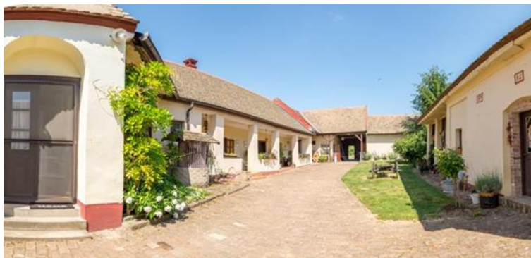
Slika 7. Apartman Tri mudraca

tradicionalnih jela), vožnja čiklovima (vožnja tradicionalnih ribarskih čamaca), panoramski letovi, geocaching (igra traženja skrivenog blaga pomoću tehnologije GPS -a), streličarstvo (korištenje luka i strijele za gađanje klasične mete ili 3D siluete), ljudski stolni nogomet.