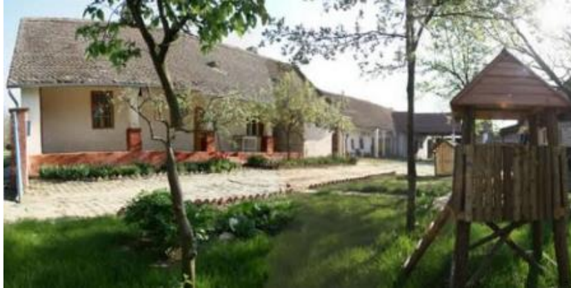
Slika 11. Imanje Kukuriku