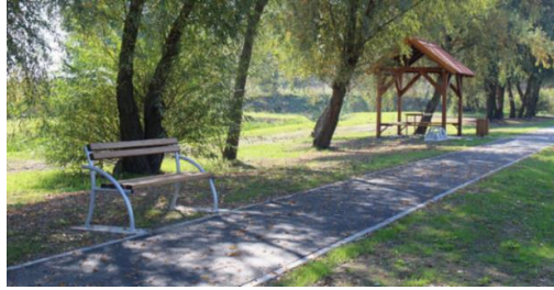
Slika 39. Uređeni prostor oko ribnjaka