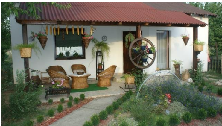
Slika 10. Seljačko domaćinstvo Bakine čarolije

Po pitanju najma smještaja izdvajaju se apartman Bakine čarolije , apartman Predsjednički apartman , manji apartman Čiča Tomina koliba , bungalov Robinzon, Baraka i Kokotel – Hotel za koke . Baranjski Baka Building (BBB) nudi razne igre poput igre s klikerima, gađanje mete s pračkama/šlajderima, gađanje mete s lukom i strijelom, potezanje konopa/užeta, skakanje u vrećama, gledanje kroz stare kaleidoskope, promatranje ptica s dalekozorom u lovačkoj čeki, seoski mini golf. U ponudi se još nalazi i kuća za odmor na Banovom brdu. Ova kuća za odmor idealna je za izlete, druženja i razne proslave.