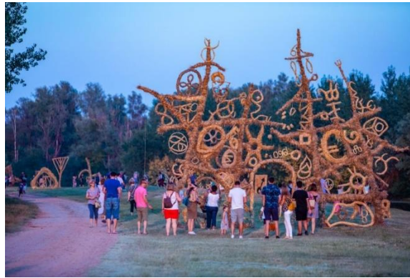
Slika 24. Slama Land Art Festival

Općina Bilje svake godine organizira Slama Land Art Festival . Manifestacija spaja kulturnu i tradicijsku baštinu, koristeći prirodne resurse i promovirajući načela održivog razvitka (Turistička zajednica Općine Bilje, 2024). Održava se svake godine u kolovozu.