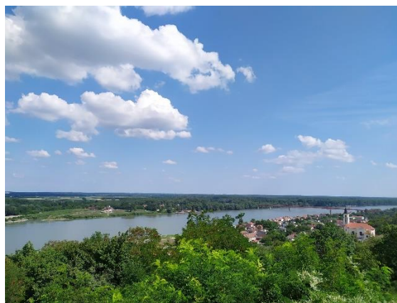
Slika 4. Rijeka Dunav u Batini

Dunav je druga najduža rijeka u Europi (nakon Volge). U Baranji Dunav čini prirodnu granicu prema Srbiji. Dunav je važan za riječni promet i povezanost Baranje s međunarodnim trgovačkim putevima. Na Dunavu su često organizirane turističke ture i vožnje čamcima.