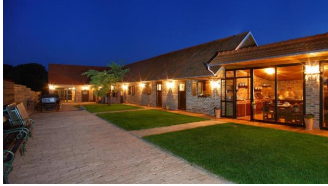
Slika 8. Seosko gospodarstvo Ivica i Marica