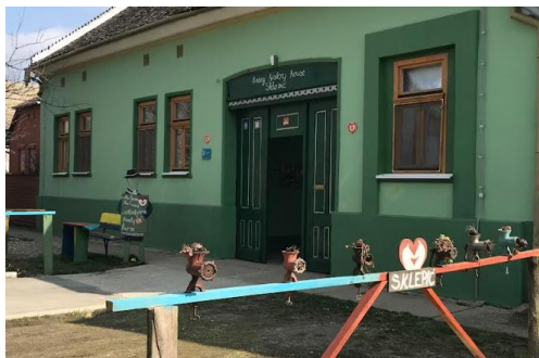
Slika 6. Autohtono seljačko gospodarstvo Sklepić

Drugi objekt je seljačko gospodarstvo iz 1897. godine. Na njemu je moguće razgledanje etno-zbirke s oko 200 predmeta (Sklepić autohtono seljačko-obiteljsko turističko gospodarstvo, 2024). U turističkoj ponudi izdvaja se i radionica lončarstva, jahanje konja, obilazak najdubljeg baranjskog podruma i čardaka (katno spremište za kukuruz).