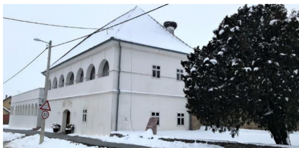
Slika 35. Stari beljski podrum

Uzgoj vinove loze na Banovom brdu odvija se još od rimskog doba. Rimljani su Banovo brdo nazivali Mons Aureus (Zlatno brdo) . Zasluga za uzgajanje vinove loze prepisuje se vinskom caru Probu (rimski car Marcus Aurelius Probus, 276. – 282. g.) koji je sadio vinograde uz Rajnu i Dunav. Vinogradarstvo u Baranji je toliko značajan da se, po oslobođenju od Turaka (1687. g.), grozd stavlja u grb Baranjske Županije. U periodu od 1890. do 1893. godine vinogradi su opustošeni napadom filoksere (lisne uši). Stari vinski podrum Belje spominje se prvi put u opisima Mohačke bitke (1526. g). U njemu su tada boravili turski vojnici Sulejmana Veličanstvenog, kada je ovaj prostor korišten u svrhu konjušnice i barutane. Donja etaža je korištena kao tamnica s preko 1 200 četvornih metara. Danas je ovaj podrum najveći podrum u Hrvatskoj. Na gornjoj etaži podruma nalazi se ukupno 71 velika bačva od slavonskog hrasta, a od toga ih je 17 kapaciteta 10 000 litara, a ostalih 54 kapaciteta 2 000 litara. Tu je smješten vrhunski arhiv u kojoj se nalazi preko 20 000 boca, a među njima najstarije iz 1949. godine (Alilović, 2015: 26). U sklopu podruma nalazi se i kušaonica vina gdje uz stručno osoblje i vodstvo, posjetitelji mogu kušati i upoznati se s beljskim vinima. Vinski podrum je obnovljen 2009. godine stoljetnom ciglom uvezenom iz Beča. U njemu i danas odležavaju najbolja beljska vina. Vina koja se proizvode jesu Graševina, Chardonnay, Frankovka, Pinot Crni, Merlot, Cabernet Sauvignon .