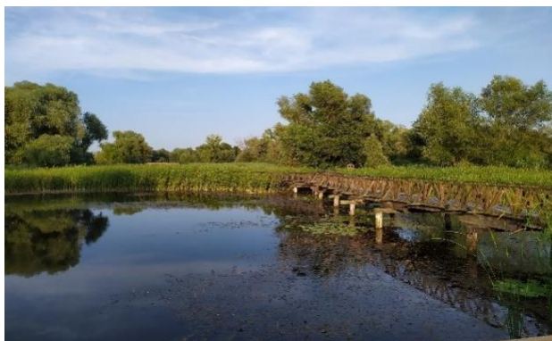
Slika 1. Park prirode Kopački rit