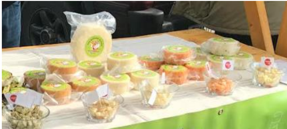
Slika 31. Domaći mliječni proizvodi