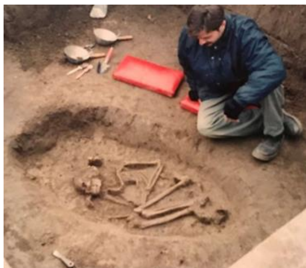
Slika 34. Ostatci sopotske kulture u Kneževi Vinogradima