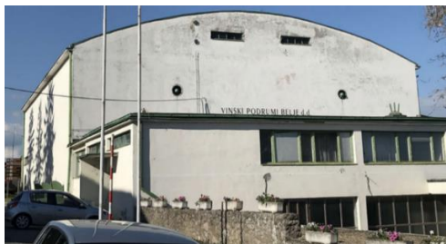
Slika 36. Napuštena vinarija Belje