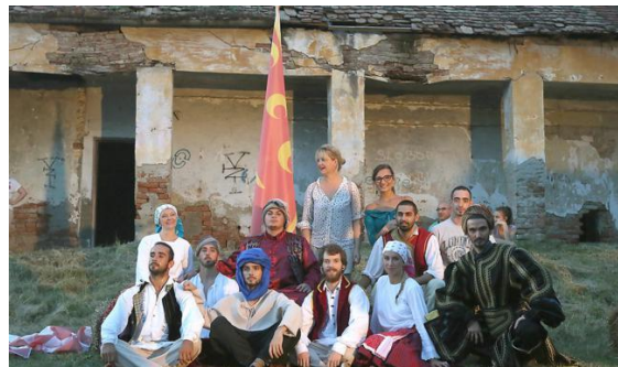
Slika 25. Tarda Fest – Povijesni festival kulture i običaja iz otomanskog razdoblja

Poznata je činjenica da je čuveni Sulejmanov most bio negdje na prostoru Osijeka i Baranje. Most išao je upravo do Darde tj. današnjeg perivoja Dvorca Esterhazy (Općina Darda, 2024). Na prostorima Dvorca Esterhazy održava se ova manifestacija.