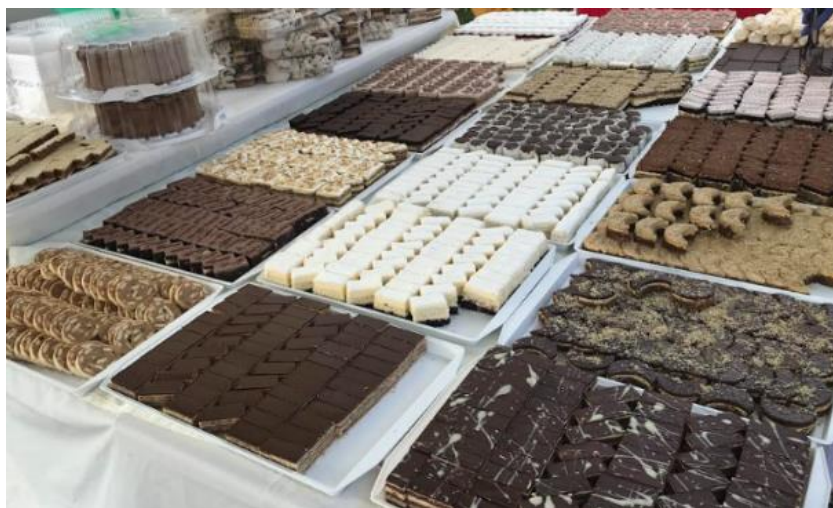
Slika 33. Domaći kolači