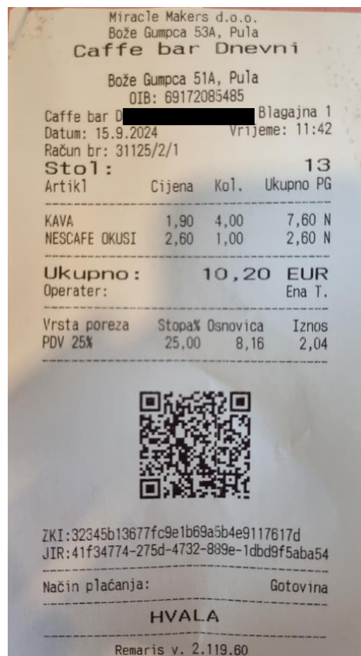
Slika 3. Sadržaj računa u ugostiteljskom objektu „Dnevni“

Bez obzira na kakav se način obavlja naplata računa, obveznici fiskalizacije obvezni su na računu izraziti točne i cjelovite nabrojane podatke. Obveznici fiskalizacije koji realiziran promet naplaćuju sredstvom koji se ne smatra prometom gotovine nisu obvezni iskazati JIR, zaštitni kod izdavatelja obveznika fiskalizacije i QR kod.