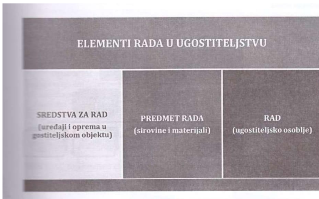
Slika 1. Potrebni elementi rada u ugostiteljstvu

Izvor: Galičić Vlado (2012)., Uvod u ugostiteljstvo, str. 41.