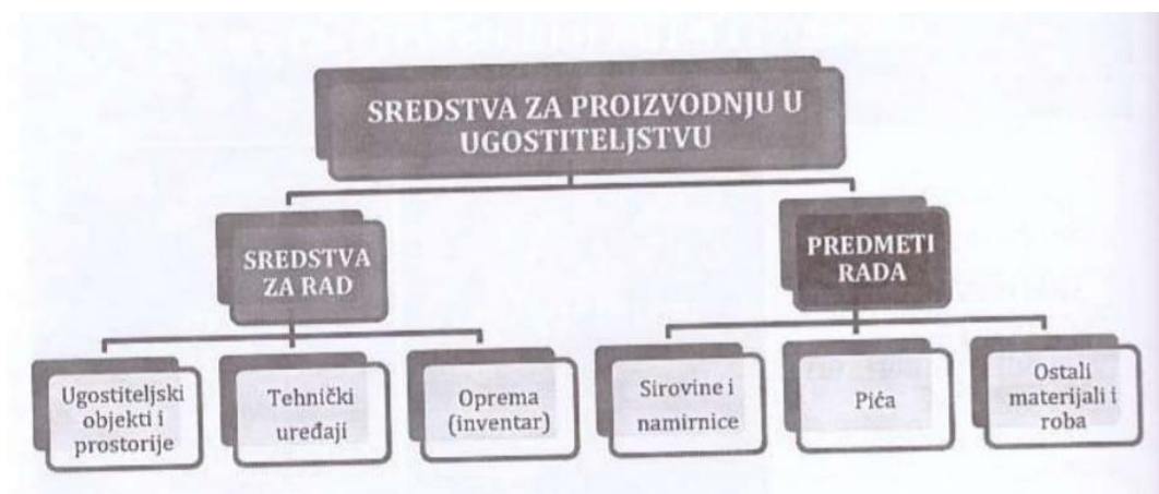
Slika 2. Sredstva za proizvodnju u ugostiteljstvu

Izvor: Galičić Vlado (2012)., Uvod u ugostiteljstvo, str. 42.