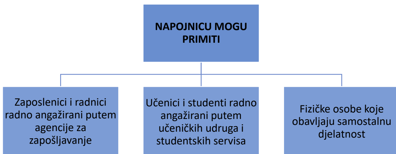
Slika 12. Sve osobe koje mogu ostvariti neoporezivu napojnicu