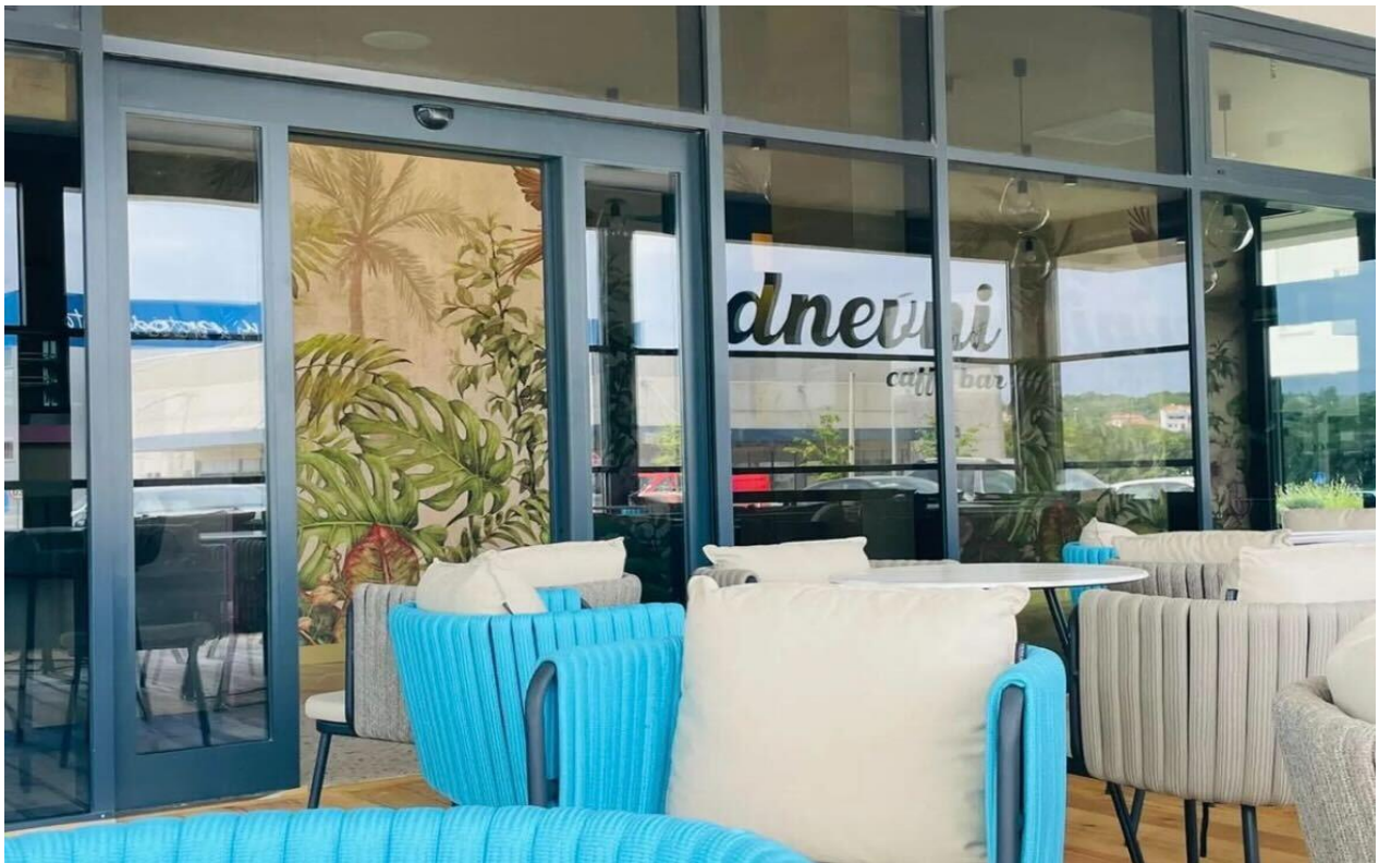
Slika 10. Ugostiteljski objekt „Dnevni“

Izvor: Preuzeto sa Restaurant Guru, „Caffe bar Dnevni“, dostupno na: https://restaurantguru.com/Caffe-bar-Dnevni-Pula , pristupljeno: 14.9.2024.