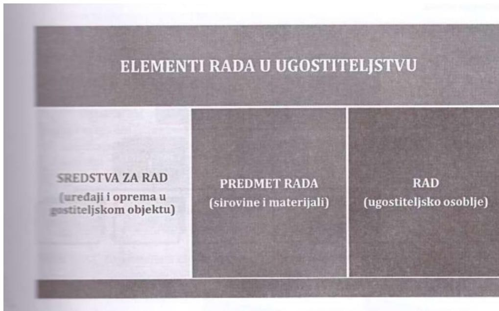
Slika 1. Potrebni elementi rada u ugostiteljstvu