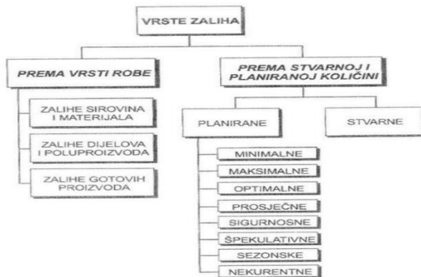
Slika 5. Vrste zaliha