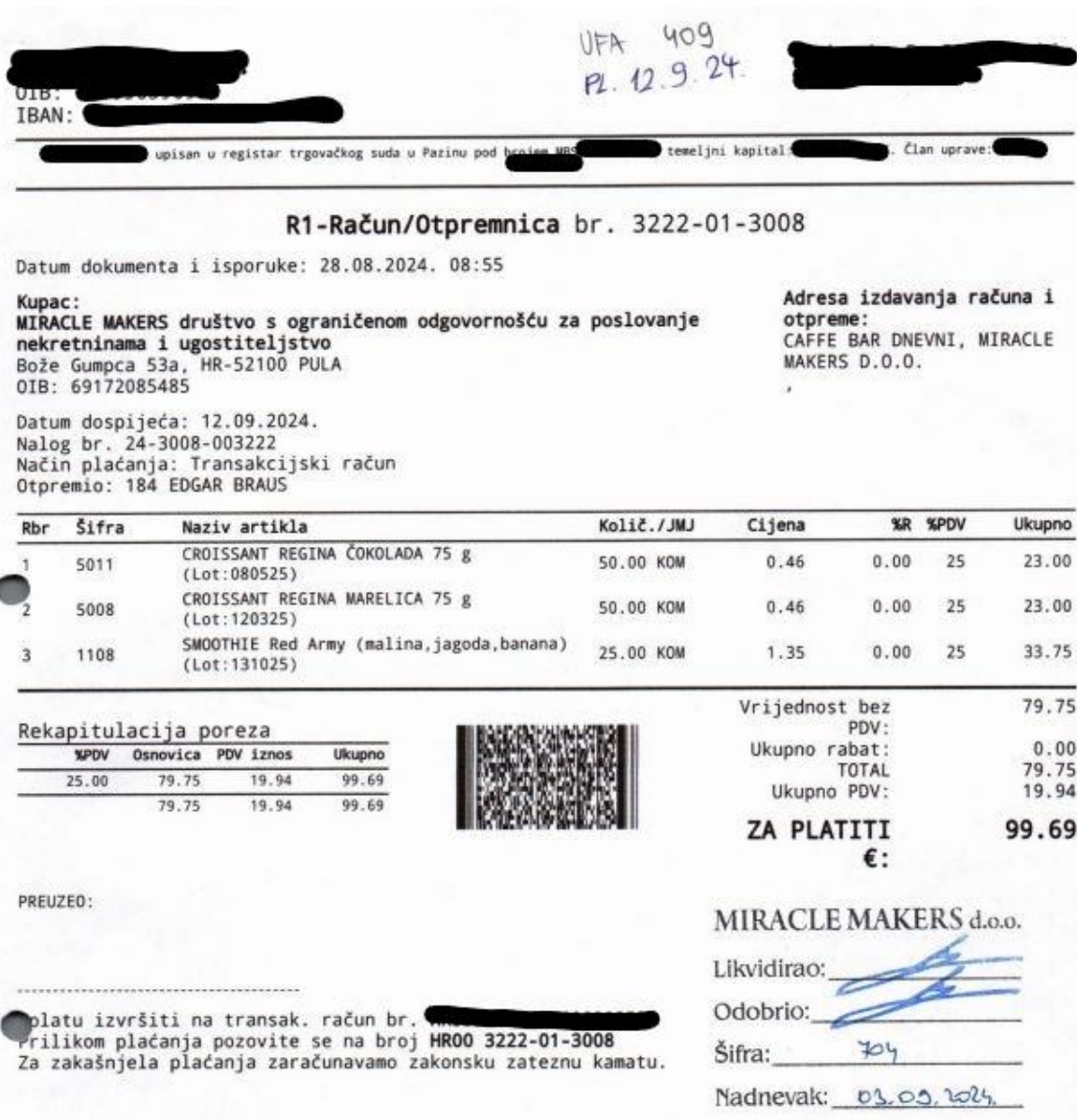
Slika 16. Faktura dobavljača