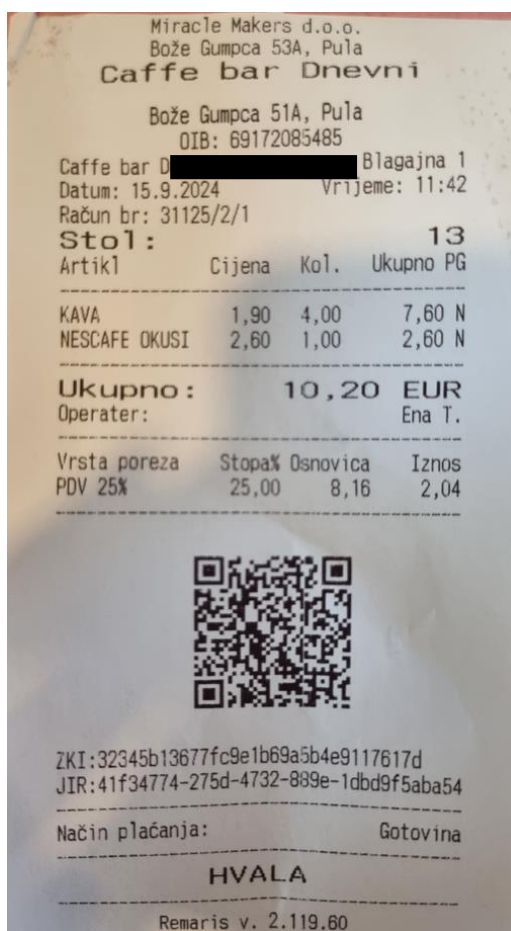
Slika 3. Sadržaj računa u ugostiteljskom objektu „Dnevni“

Bez obzira na kakav se način obavlja naplata računa, obveznici fiskalizacije obvezni su na računu izraziti točne i cjelovite nabrojane podatke. Obveznici fiskalizacije koji realiziran promet naplaćuju sredstvom koji se ne smatra prometom gotovine nisu obvezni iskazati JIR, zaštitni kod izdavatelja obveznika fiskalizacije i QR kod.