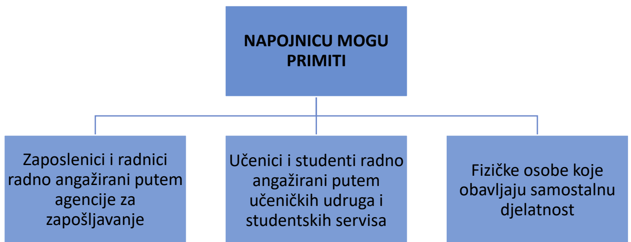
Slika 12. Sve osobe koje mogu ostvariti neoporezivu napojnicu

Izvor: Božina A., Vuk J., Računovodstvo nagrade za dobro obavljenju uslugu – napojnice, RRIF, 2024., str. 29