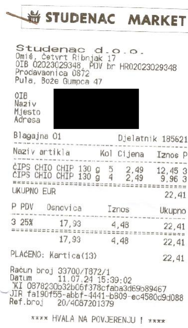
Slika 4. Račun dobavljača za grickalice priznate kao trošak reprezentacije