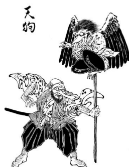
Slika 7 prikaz daitengu i kotengu

Gledajući tengu iz perspektive reinkarniranih zlih svećenika ili redovnika koji odstupaju od budističkih principa, može se reći, kako Foster (2015: 133) navodi, da „istovremeno, možemo zamisliti kako bi tengu mogli postati snažni simboli autsajdera, predstavljajući pobunjenički, anti-autoritativni duh“. U tom kontekstu, autor sugerira, tengu prikazuju sve one koji se suprotstavljaju uvriježenim normama i autoritetima te upravo taj njihov anti-autoritativni duh prikazuje zašto im se pripisuju tajne borilačke vještine. Drugim riječima, kroz borilačke vještine tengu simboliziraju moć i samodostatnost onih koji odbijaju slijediti tradicionalne putove, u ovom slučaju principe budizma, i preferiraju vlastite koji su često obilježeni skrivenim metodama. Navedeno se pronalazi u priči o tengu i velikom ratniku japanske povijesti Minamoto no Yoshitsune. Autor objašnjava da je Yoshitsune bio mlađi brat Minamoto no Yoritomoa, vođe Genji snaga koje su pobijedile u Genpei ratu (1180.–1185.), velikog građanskog sukoba koji je doveo do osnivanja vlade Kamakure. Nadalje, Yoshitsune kao Genji general bio je poznat po svojim vojnim vještinama kojeg su ga tengui naučili dok je kao dijete živio u hramu Kurama (današnjem Kyotu). Ranije spomenuti odnos između tengu i Yoshitsune pronalazi se u priči u kojoj Foster (2015:134) navodi: