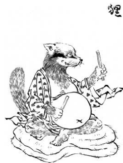
Slika 11 tanuki

Životinje, bile stvarne ili mitološke, također imaju značajno i utjecajno mjesto u japanskom folkloru što se odražava i na ove yōkaije jer su tanuki (jap. 狸) stvarne životinje. Foster (2015: 186) ih opisuje kao male, noćne, svejede sisavce koji izgledaju poput mješanca rakuna i vjeverice.