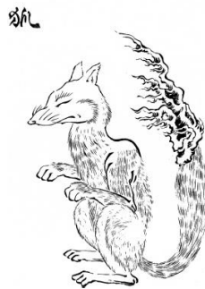
Slika 13 kitsune

Još jedan yōkai koji odražava životinjski svijet u japanskom folkloru je lisica, na japanskom poznata kao kitsune (jap. 狐). Kitsune je jedan od najzanimljivijih i najpoznatijih yōkaija ne samo u japanskoj kulturi i folkloru već je ovo nadnaravno biće fasciniralo ljude i izvan zemlje. (Foster, 2015: 177)