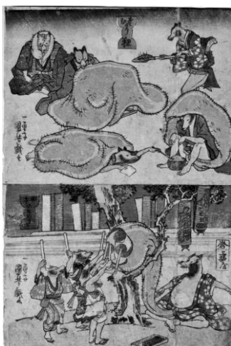
Slika 12 prikaz tanukijevih mitoloških sposobnosti

Tijekom razdoblja Meiji, tanuki su nastavili zauzimati važno mjesto u usmenim predajama i folkloru. Iako su se društvo i religijski pogledi mijenjali pod utjecajem modernizacije, ova nadnaravna bića nastavila su biti dio japanskog naroda kao simboli prirodnih duhova i zabavljača. Priče o njima služile su kao način da se očuva dio tradicije i povezanosti s prirodom usprkos ubrzanim društvenim promjenama. Tanukiji su se ponekad pojavljivali i kao anegdote i izvještaji u novinama time naglašavajući njihovu trajnu prisutnost i značaj u svijesti japanskog naroda. Ujedno, zahvaljujući tim pričama i izvještajima, tanukiji su održali svoje prisustvo i bit tijekom ovog razdoblja koje je bilo obilježeno odbacivanjem starih vjerovanja u korist suvremenijih i modernijih pogleda na svijet. (Foster, 2015: 189)