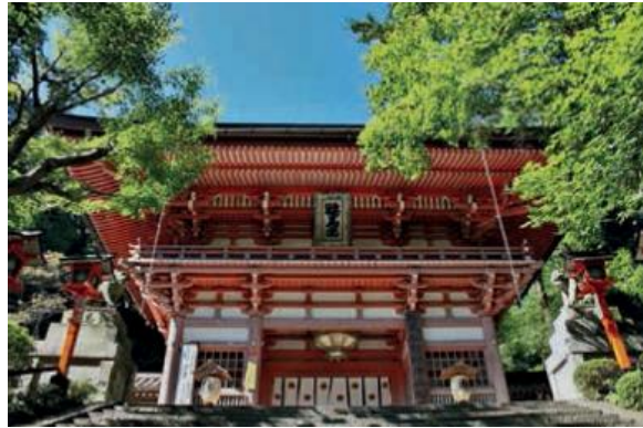
Slika 8 prikaz hrama Kurama u kojem su tengu navodno boravili

razloga da ne poznajemo sažaljenje. Zato pomozimo Ushiwaki, naučimo ga metodi tengua tako da može napasti očevog neprijatelja“.