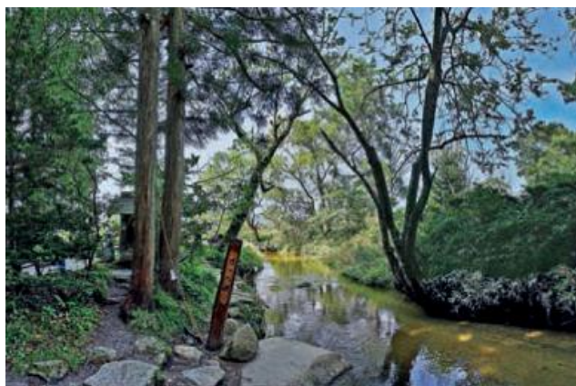
Slika 9 prikaz rijeke iza hrama Jogen-ji koji je navodno bio kappin dom