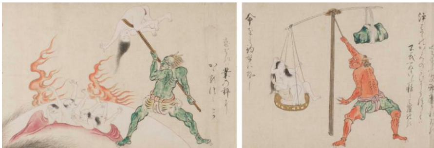
Slika 2 Oni kao izvršitelji kazni

Dakako, karakteristike i prikaz koji su oniji usvojili kroz indijska mitološka bića putem budizma dalje se očitavalo na njihov razvoj. U budističkim svicima poznatim kao jigoku zōshi (jap. 地獄草紙) iz 12. stoljeća, koji su kako Reider (2010: 38–39) objašnjava, proizvedeni s ciljem religijskog poučavanja da se promatračima tih svitaka pobudi svijest o prisutnosti užasnog pakla, oniji su već spomenuto, poprimili ulogu izvršitelja kazni, odnosno mučitelja.