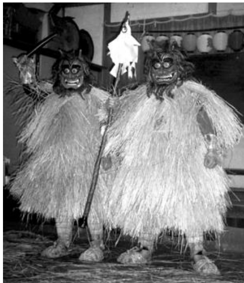
Slika 5 namahage u paru

Običaj Namahage odvija se na način da mladići s poluotoka Oga koji imitiraju namahage odnosno onije oblače kostime, plašteve koji su napravljeni od slame. Uz to nose rukavice i cipele koji su prekriveni slamom te nose noževe i duge štapove ukrašene bijelim trakama od papira. Maske namahagea koji ovi mladići nose su obojene crvene ili plave boje, pri čemu autor napominje, namahage putuju u parovima gdje jedan član nosi crvenu, a drugi plavu masku. (Foster, 2013: 305) Reider (2010: 4) objašnjava da kada su mladići pretvoreni u namahage , prije nego što pođu na svoj zadatak okupljaju se ispred hrama odnosno, ispred seoskog božanstva, gdje ih svećenik hrama prema šintoističkim načelima ritualno pročišćava. Nadalje, od svog pročišćenja njihova daljnja uloga je hodati snježnim ulicama od kuće do kuće zahtijevajući ulazak. Unutar kuće, traže djecu, vrišteći i tjerajući ih po sobi kako bi ih naučili i upozorili na dobro ponašanje što rezultira time da se djeca preplaše do suza ili se skrivaju iza roditelja. Nakon njihovog zastrašujućeg djela, autor tvrdi, primaju ponude hrane i sakea 1 od stanovnika. Zatim ih blagoslivljaju sa srećom za nadolazeću godinu i tako odlaze do idućeg domaćinstva. (Foster, 2013: 302)