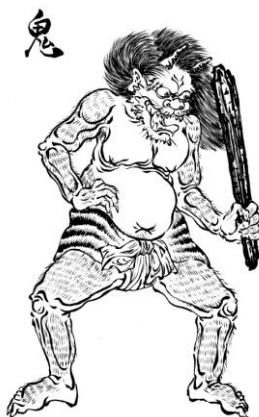
Slika 1 oni