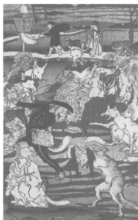
Slika 14 prikaz kitsuneine sposobnosti mijenjanja oblika