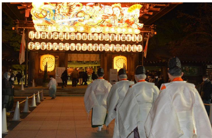
Slika 3 Tsuina ritual

Još jedan čest i široko rasprostranjen obred povezan s onijima je setsubun (jap. 節分). Naziv potječe od riječi setsu (jap. 節) koji označava „sezonu“ i bun (jap. 分) što znači „podjela“. Foster (2015: 124) objašnjava da se festival obilježava početkom