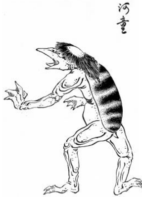
Slika 10 kappa