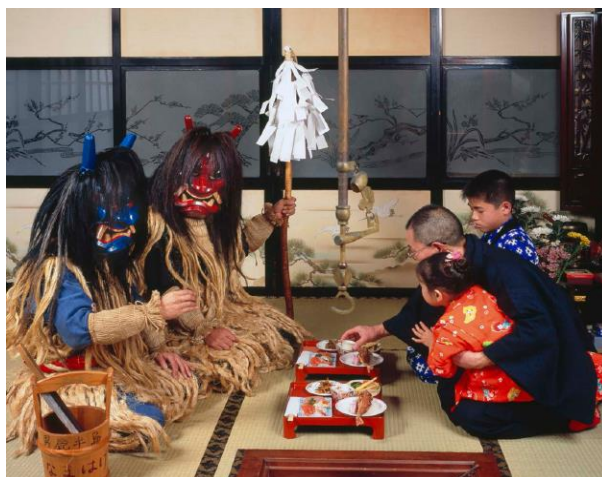
Slika 6 prikaz namahage u domaćinstvu

Poput ranije objašnjena, oniji su oblikovani nepredvidivom prirodom te poput Tsuina rituala kao i u tradiciji Namahage, može se uočiti ta njihova značajka. Reider (2010: 4–5) objašnjava da namahage , koji su prisvojili obilježja onija , prikazuju strašna bića čiji zastrašujući izgled naglašava njihovu bit. Odnosno, oni se predstavljaju kao bića koja dolaze izvana, iz drugog svijeta. Iz tog razloga namahage se pojavljuju u vrijeme kada je označen prijelaz između jedne godine u drugu. Za ljude i njihov uređen život, namahage predstavljaju već spomenuto prijeteće vanjsko, nešto što je nepoznato dok se istovremeno mogu povezati s dobrim značajkama odnosno, blagodatima koje nude ljudima. Na taj način, u njima se očituje uloga onija gdje se povezuju dva svijeta donoseći sa sobom ne samo strah već i obećanje zaštite za narednu godinu.