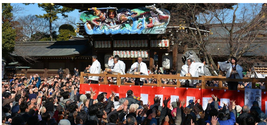
Slika 4 Setsubun

Tokuda (2018: 5) tvrdi da su se oniji u setsubunu počeli pojavljivati tijekom razdoblja Muromachi (1336.–1573. g.). U to vrijeme počeo se izvoditi obred pročišćenja koji odražava šintoistički koncept ritualnog pročišćavanja te koji se povezuje s ranije objašnjenim Tsuina ritualom, a uključuje protjerivanje zlih duhova, odnosno onija , i sprječavanje zla za nadolazeću godinu. Foster (2015: 125) pojašnjava kako se kroz običaj bacanja graha oko kuće ili kroz prozor uz uzvik „drži zle duhove vani, unesi sreću unutra!“ (jap. Oni wa soto, fuku wa uchi! , 鬼は外、福は内!) prikazuje simbolično pročišćavanje zla, dok se priroda ponovno budi. Primjer toga, može se vidjeti u hramu Rozan smještenog u Kyotu gdje autor pojašnjava da se izvodi slična ritualna prezentacija u kojoj oniji raznih boja izvode ples zastrašivanja te na kraju odlaze poraženi. Nakon onijevog odlaska, svećenici hrama bacaju grah posjetiteljima.