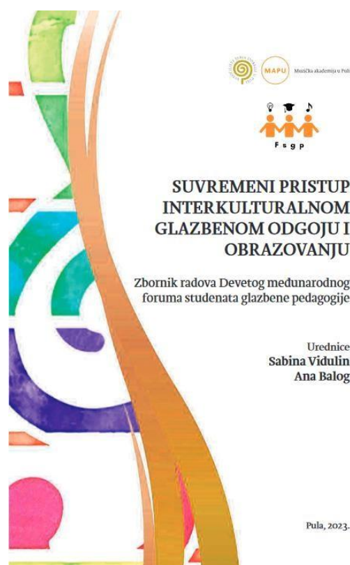
Prilog 1. Naslovnica zbornika Suvremeni pristup interkulturalnom glazbenom odgoju i obrazovanju .

Ovomu završnom radu prethodio je članak Metodički postupci obrade hrvatskih i tradicijskih pjesama na nastavi Glazbene kulture objavljen u zborniku radova studenata Suvremeni pristup interkulturalnom glazbenom odgoju i obrazovanju koji su uredile Sabina Vidulin i Ana Balog, a koji je izdalo Sveučilište Jurja Dobrile u Puli 2023. godine. Taj je objavljeni rad recenziralo dvoje stručnjaka. Tijekom oblikovanja i pisanja rada autorica se bavila problematikom kako glazbu približiti učenicima, a u procesu izrade rada bilo je potrebno produbiti znanje o samoj metodici i njezinim pravcima poučavanja, što je dovelo do proučavanja novih informacija povezanih s tim područjem. Također, kreativno je razmišljanje bilo ključno tijekom cijeloga procesa jer je iznimno važno učenicima prikazati određeno gradivo na njima što zanimljiviji način, uz naglasak na edukativni ishod. Osim samoga istraživačkog procesa, koji uključuje prikupljanje glazbenih i izvanglazbenih znanja, unaprijeđena je i kompetencija izlaganja i diskutiranja o temi s kolegama studentima i njihovim mentorima na stranome jeziku.