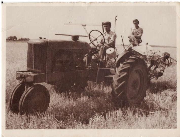
Slika 8. Žetva