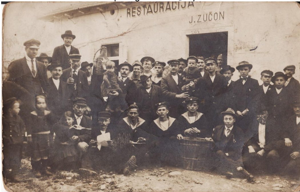
Slika 29. Ispred gostionice „Dopo lavoro“