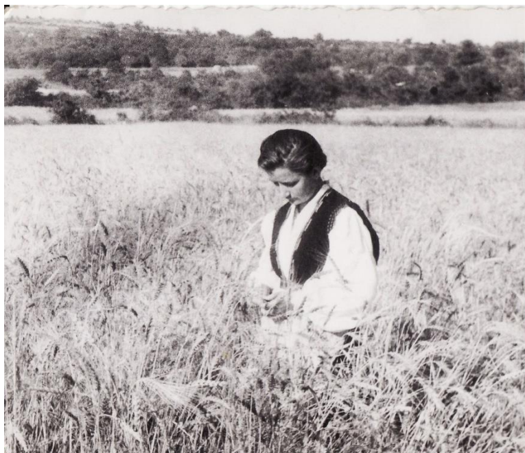
Slika 6. Medulinka u žitu