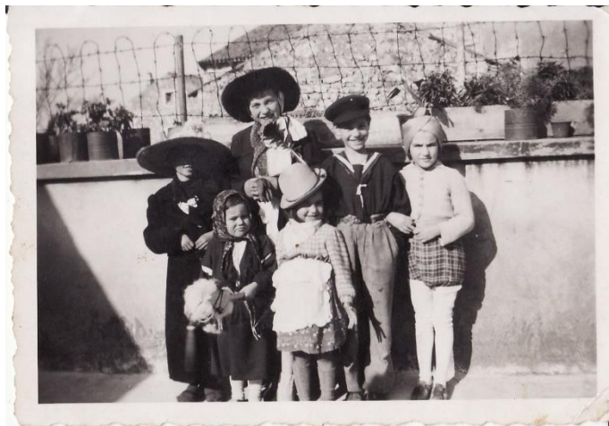
Slika 4. Medulinske maškare, 1945.