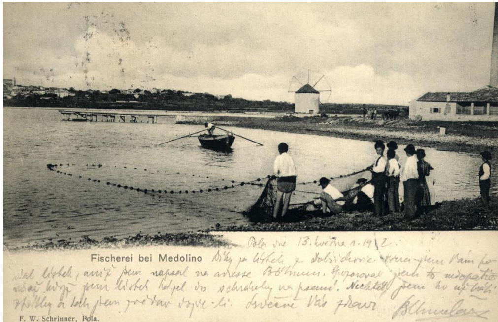
Slika 1. Razglednica Medulina, 1912.