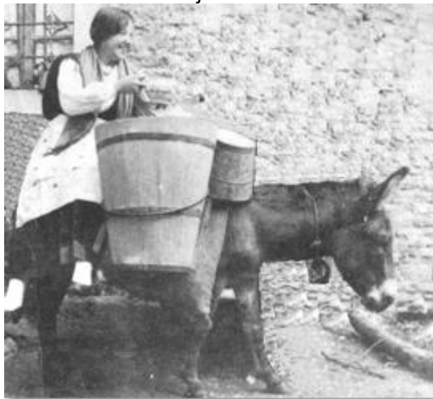
Slika 19. Donošenje vode za domaćinstvo