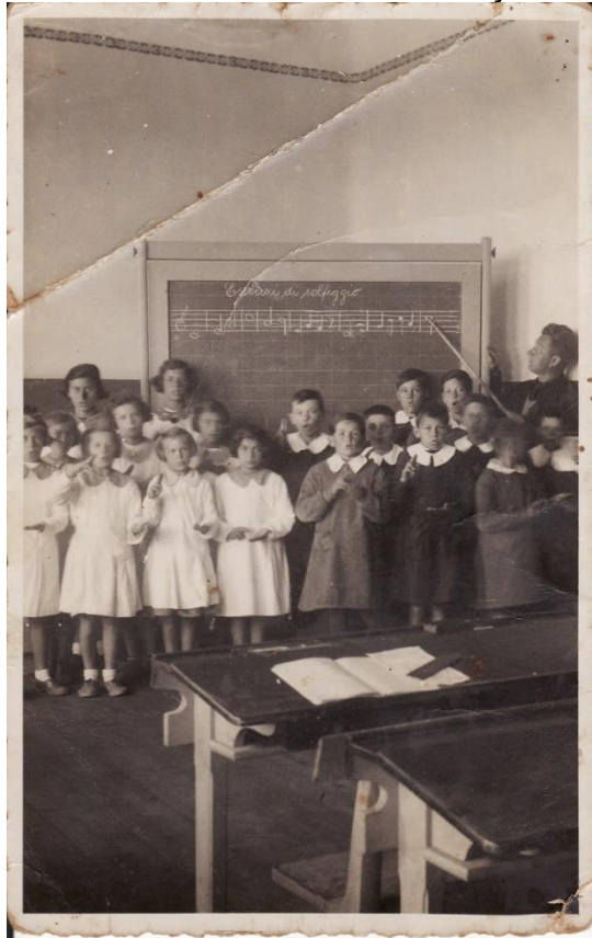
Slika 25. Škola u doba Italije