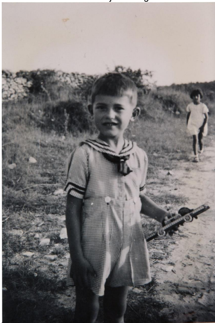
Slika 30. Dječak u igri