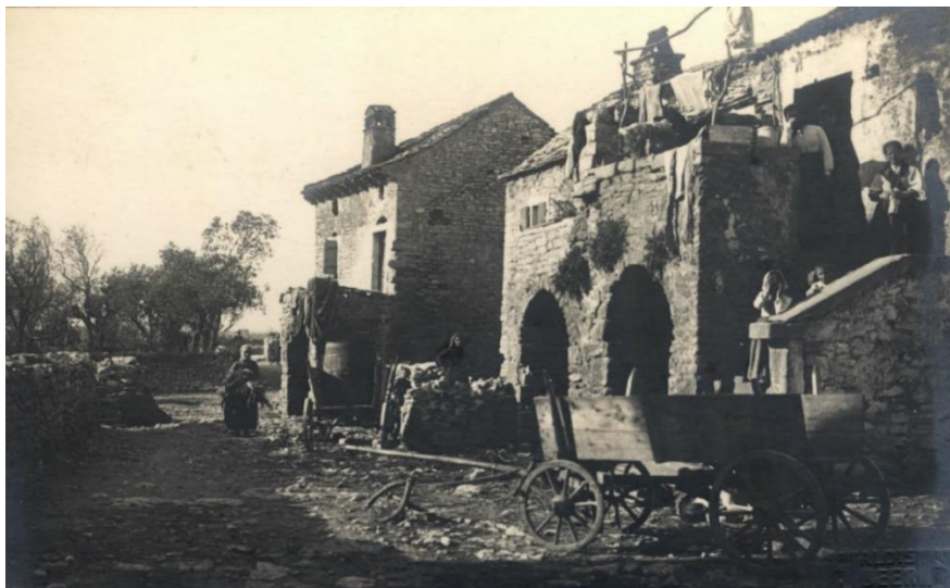
Slika 11. Selo