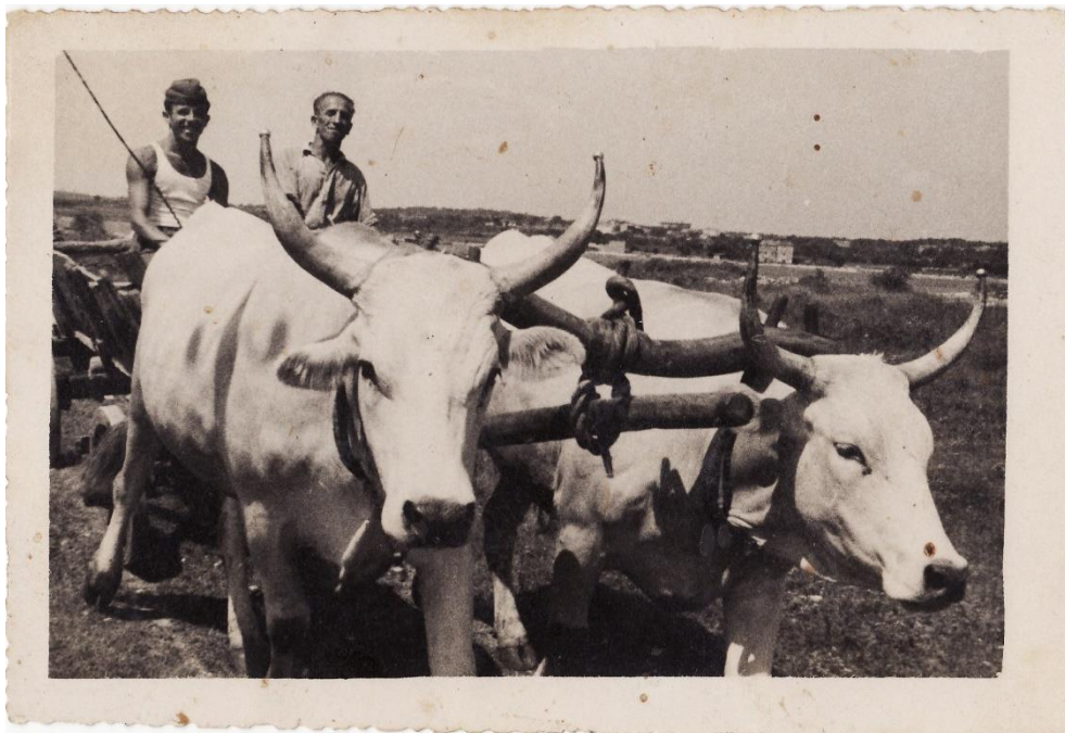
Slika 10. Medulinci se vraćaju s polja