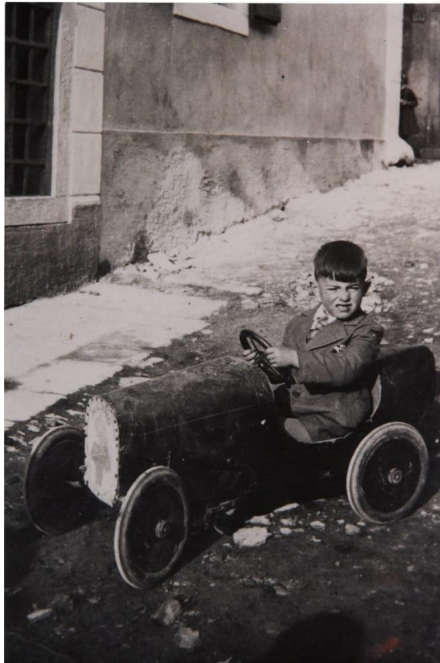
Slika 31. U autiću