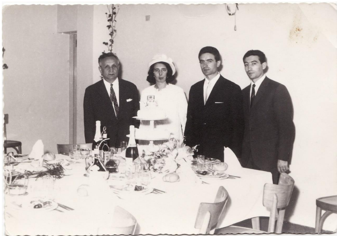
Slika 16. Vjenčanje