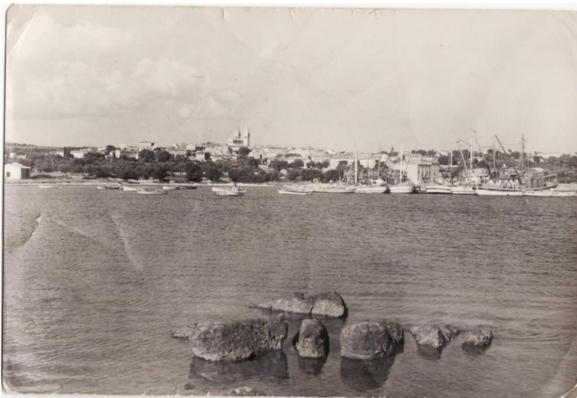
Slika 3. Medulin