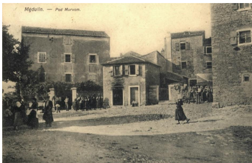
Slika 12. Pod Murvom