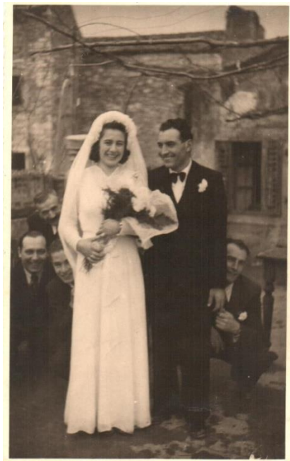
Slika 15. Medulinski pir

Na sam dan vjenčanja mladoženjini se gosti skupe kod njega, a nevjestini kod nje. U povorci, mladoženja sa svojim gostima krene po mladu. Kada bi došli kod nje, dočekale su ih određene prepreke, kao što su mreža od konopaca, voz na ulazu i slično. Stari svat pokušava nagovoriti nevjestine svatove da uđu. Nakon određenog dogovaranja pošalju im par djevojaka obučenih u mladu, ali oni kažu da ona nije njihova. Kada pošalju mladu, mladoženja odgovori „to je moja golubica“ i puste ih unutra. Malo bi se veselili uz harmoniku i krenuli zajedno prema crkvi.