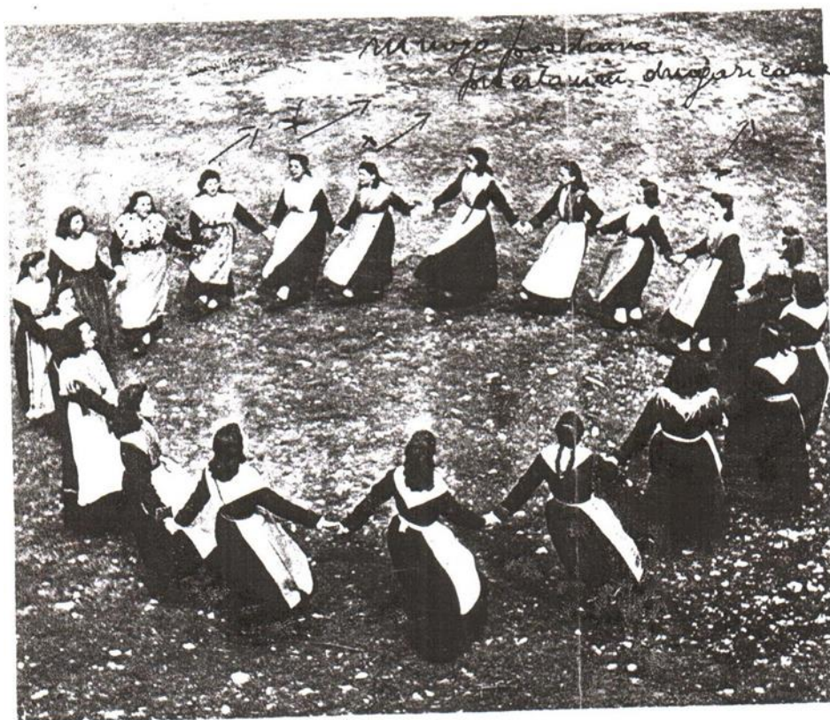
Slika 28. Medulinke u kolu