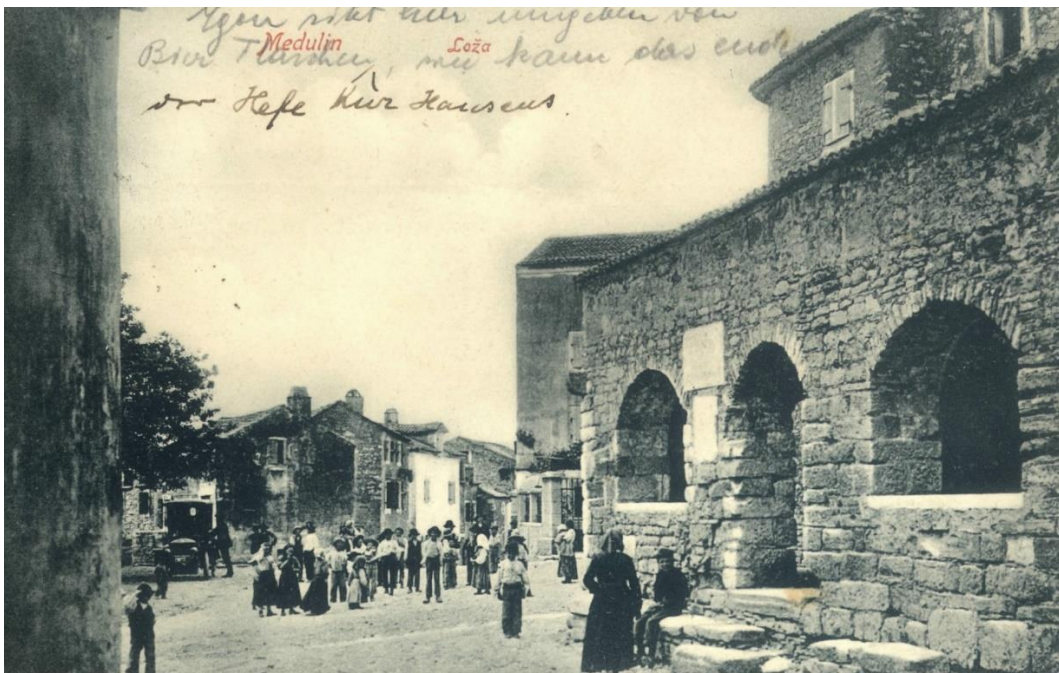
Slika 13. Medulinska Placa