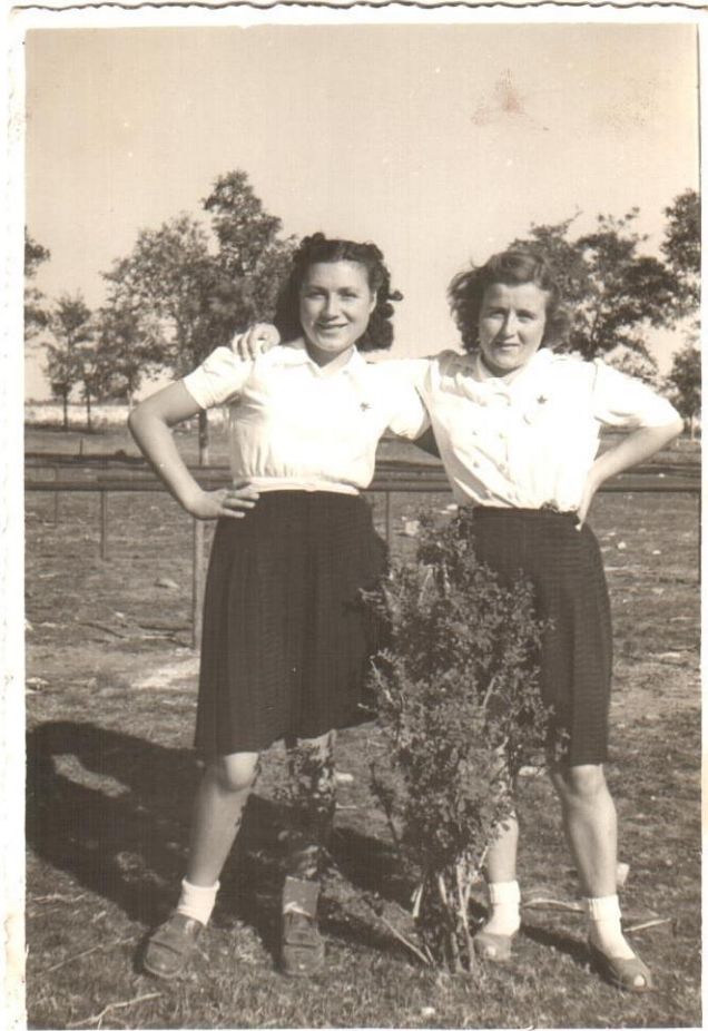
Slika 27. Prijateljstvo