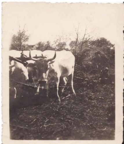
Slika 9. Boškarin