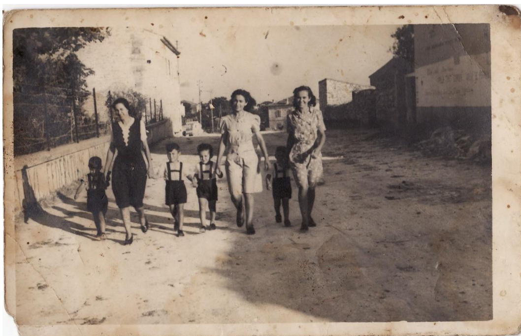
Slika 14. Djetinjstvo