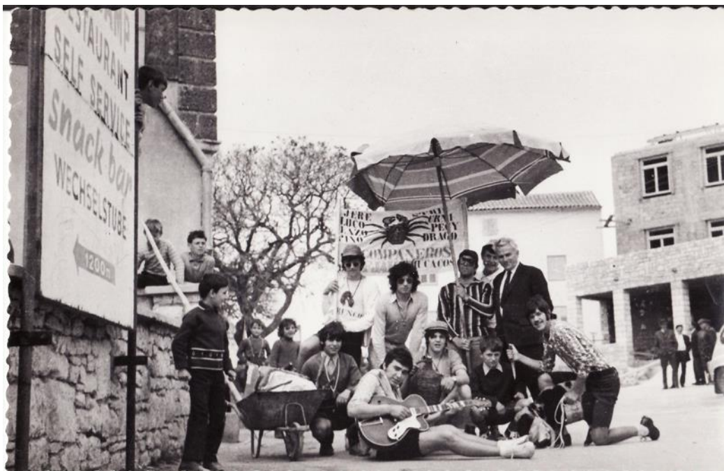
Slika 5. Maškare u Medulinu