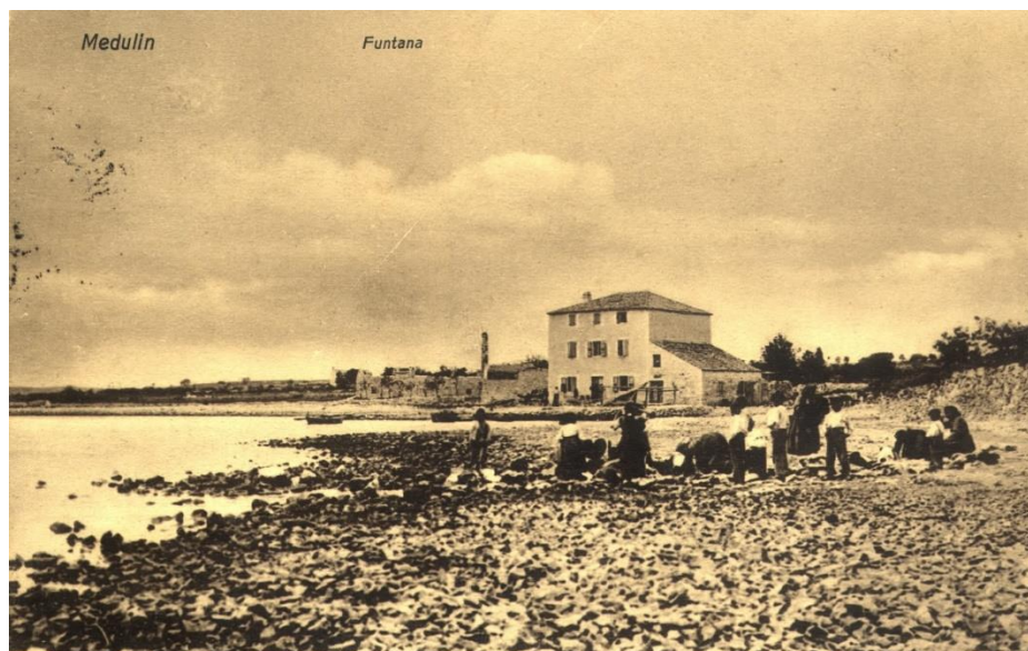
Slika 21. Na Funtani, žene režentaju robu