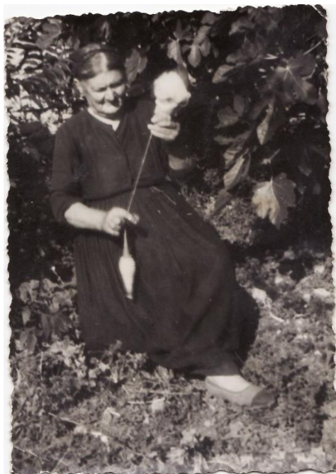
Slika 17. Medulinka prede vunu