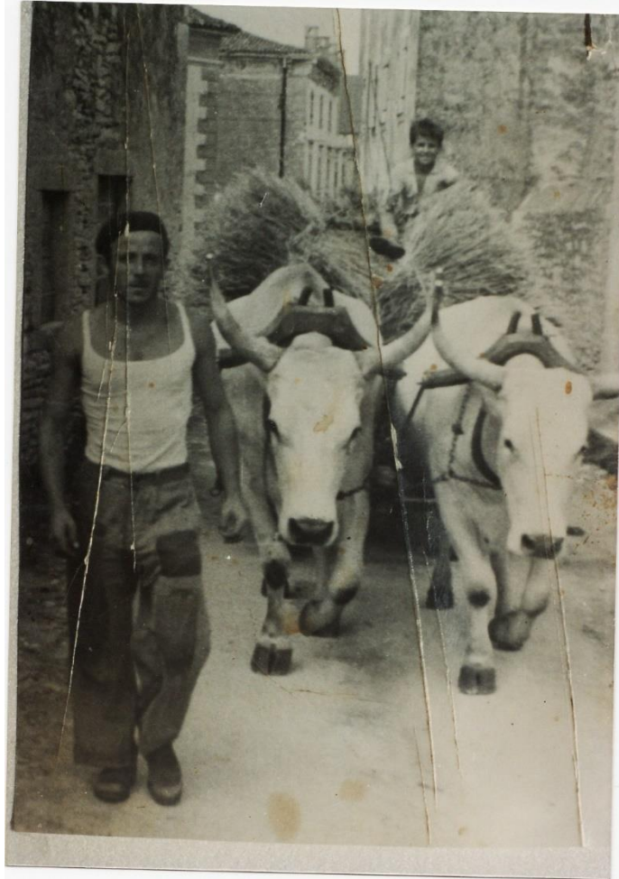
Slika 7. Žetva pšenice