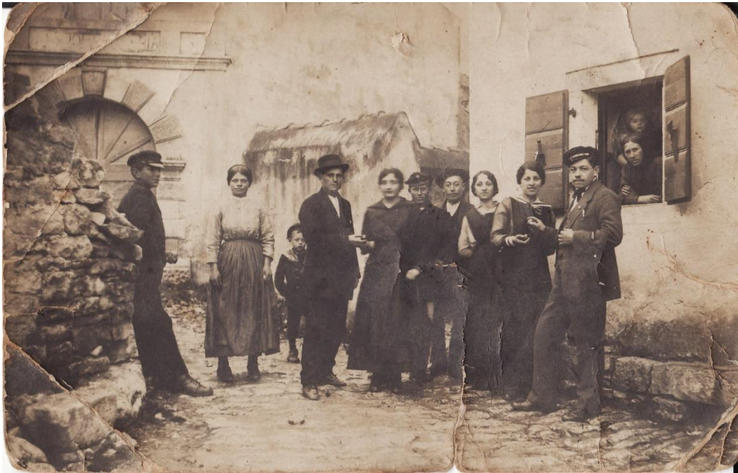
Slika 2. Druženje žitelja Medulina