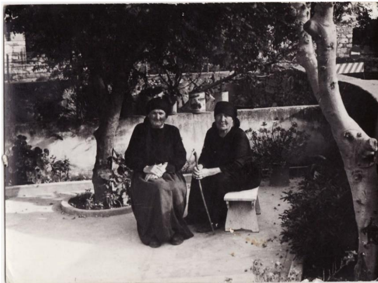
Slika 18. Na bančiću