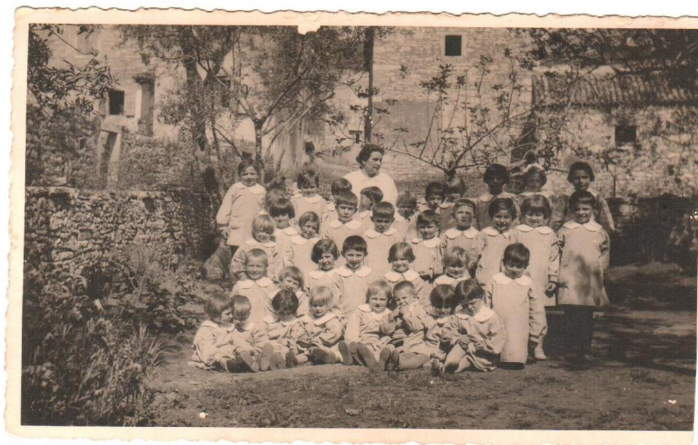
Slika 22. Medulinska djeca iz vrtića