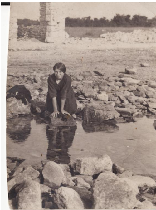
Slika 20. Medulinka na perilu