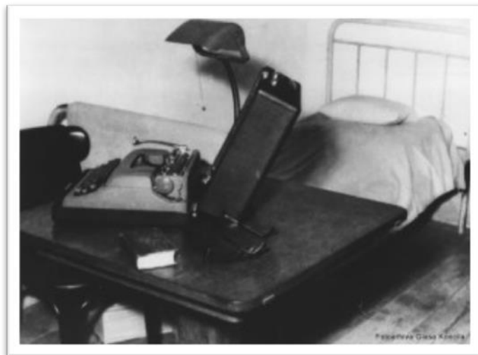
Sl. 9: Zatvorska soba nadbiskupa Stepinca u Lepoglavi

Iz zatvora je pušten 5. prosinca 1951., te prebačen u kućni pritvor u rodni Krašić, gdje je stanovao u dvije male sobice u krašićkom župnom dvoru koje mu je prepustio župnik Vraneković, a svakodnevno ga je čuvalo tridesetak policajaca, koji su pažljivo pratili tko sve dolazi u Krašić, crkvu i župni stan. U tim danima zatočeništva, nije smio javno nastupati kao biskup, te stoga u crkvi nikad nije imao mitru niti biskupski štap.