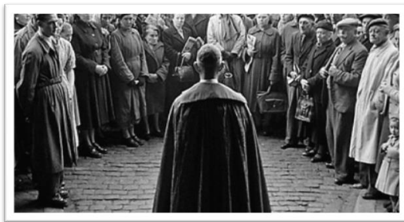
Sl. 6: Nadbiskup Stepinac u vrijeme Drugog svjetskog rata

Hitlerov je GESTAPO čak pripremio plan da ga ubije, a vlasti su više puta tražile da ga Sveta Stolica makne s položaja nadbiskupa u Zagrebu. Usprkos svemu tome, Stepinac je bio ustrajan u svom djelovanju.