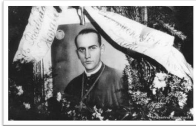
Sl. 10: Detalj sa Stepinčeva pokopa

Smrt je dočekaao miran, pri punoj svijesti, moleći za svoje progonitelje i opraštajući svima koji su mu nanijeli zlo. Umro je u Krašiću 10. veljače 1960. Unatoč početnom protivljenju vlasti, njegovi posmrtni ostaci na kraju su pohranjeni u zagrebačkoj katedrali.