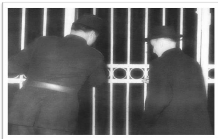
Sl. 8: Stepinčevo uhićenje 1946.

Dana 19. listopada 1946. Stepinac je prebačen u Lepoglavu, nekadašnji pavlinski samostan koji je prenamijenjen u zatvor. Tu je proveo pet godina, u posebnom krilu za zatvorenike potpuno odijeljene od ostalih. Svakodnevno je služio mise u susjednoj ćeliji koja je pretvorena u kapelicu.