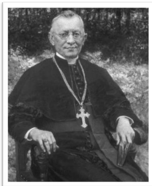
Sl. 5: Zagrebački nadbiskup Antun Bauer

Stepinac nije mogao mirovati: nagovorio je biskupa Bauera na izdavanje okružnice, što je ovaj 25. studenog 1931. i učinio, kojom je osnovana ustanova Caritas na području Zagrebačke biskupije s ograncima u svakoj župi. Ustanova se trebala baviti dobrotvornim radom, a na njezino čelo je postavljen upravo Stepinac, koji se oduševljeno prihvatio posla. Njegove prve akcije na tom mjestu bile su otvaranje pučkih kuhinja, te poticanje ljudi na davanje dobrovoljnih priloga.