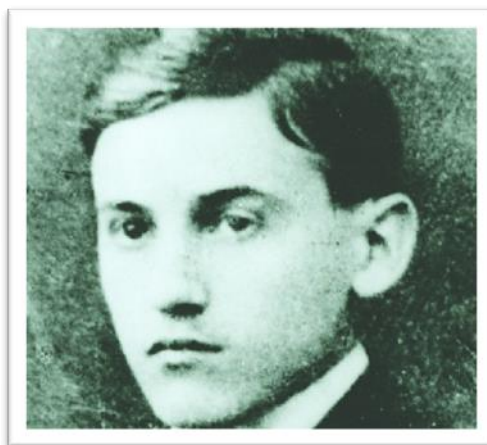
Sl. 2: Mladi Alojzije Stepinac

Nakon što je u mjesnoj osnovnoj školi završio četiri razreda, 1909. poslan je u klasičnu gimnaziju u Zagrebu, kao učenik koji plaća školovanje.