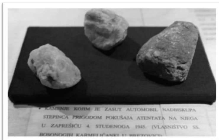
Sl. 7: Kamenje kojim je u Zaprešiću napadnut Alojzije Stepinac

Cijelo vrijeme, komunistička tajna služba uhodila je i prisluškivala Stepinčevu rodbinu, maltretirajući i progoneći one koji nisu surađivali s režimom, primjerice – njegov nećak je teško ranjen u dva atentata, zlostavljan u kaznionici, te uslijed svega psihički propao i završio u duševnoj bolnici. Njegova sestra Štefanija imala je psihičke probleme uslijed toga.