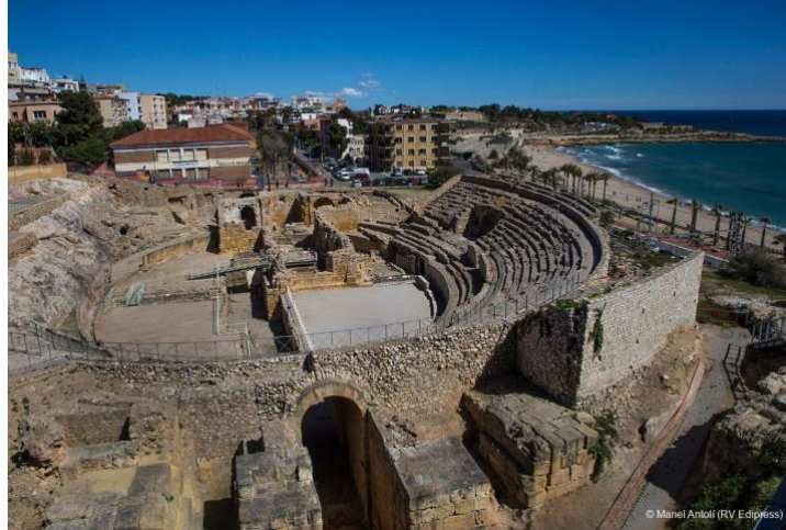
Slika 8. Amfiteatar u Tarragoni