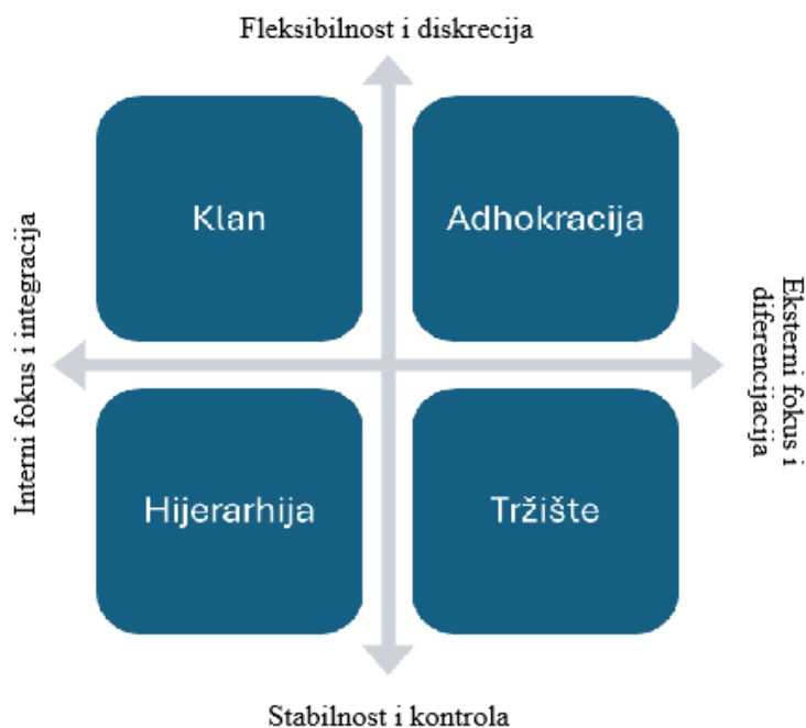
Slika 2: Vrste kulture prema CVF-u