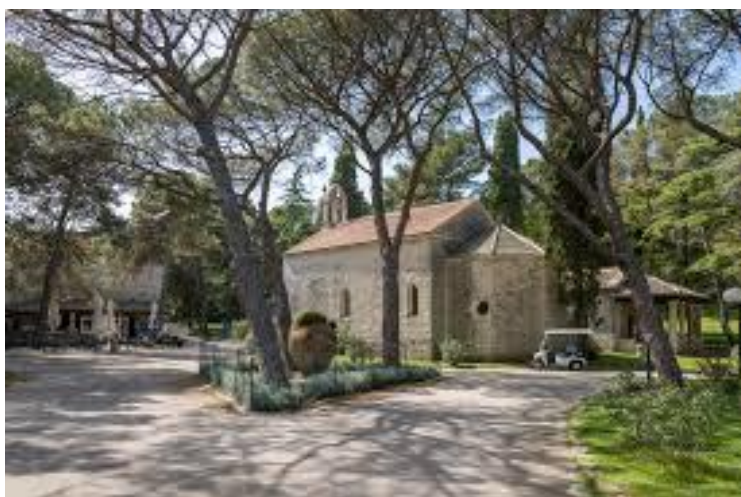
Slika 13. Crkva sv. Germana (Nacionalni park Brijuni (2024) Dostupno na: https://www.np-brijuni.hr/hr/brijuni/kulturno-povijesna-bastina/graditeljska-bastina (05.06.2024.))