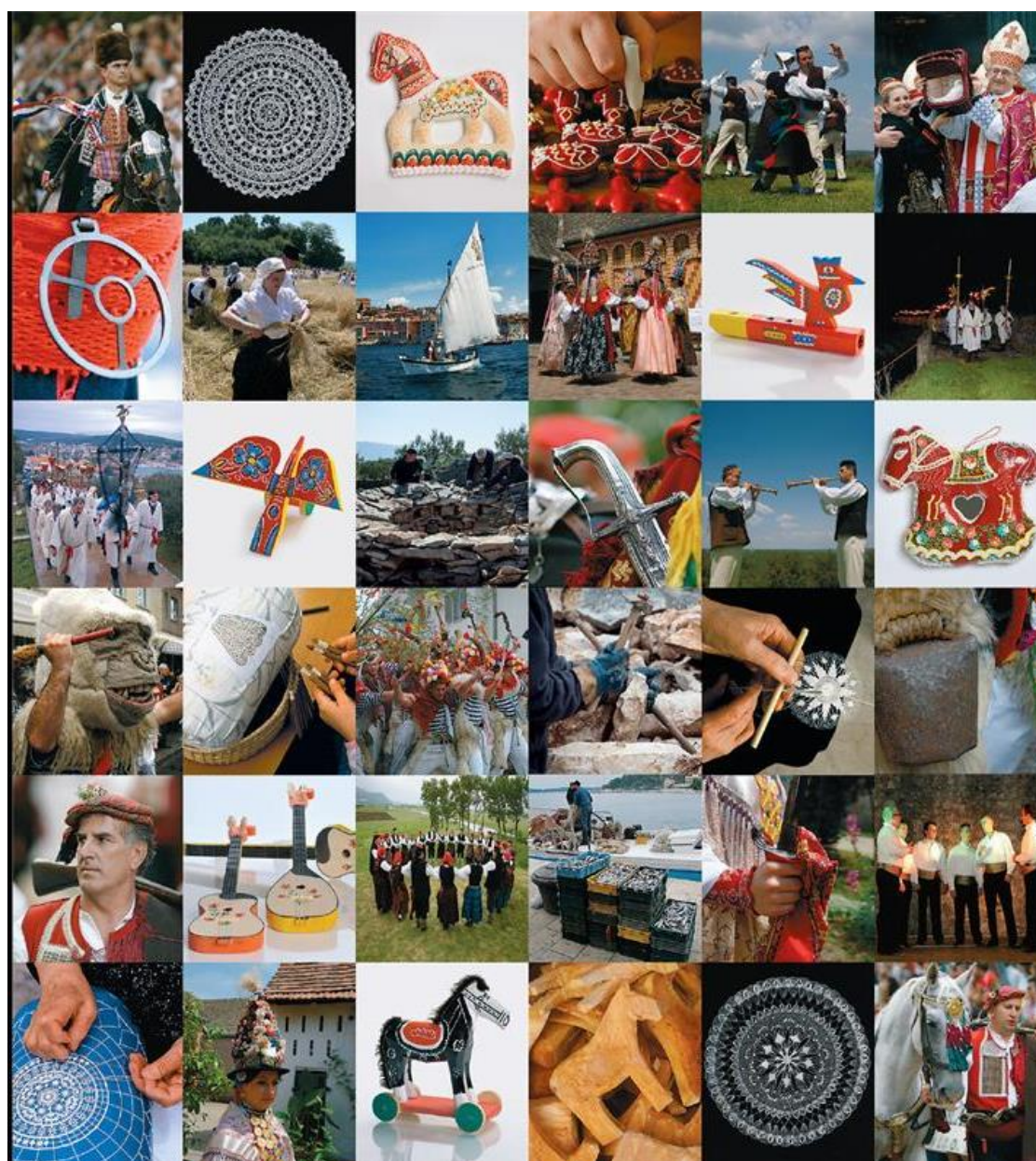
Slika 16. Nematerijalna kulturna baština Republike Hrvatske na UNESCO-ovoj listi (Ministarstvo kulture i medija Republike Hrvatske)

Također, na UNESCO-ovom Popisu svjetske baštine nalaze se i sljedeća nepokretna kulturna dobra s područja Republike Hrvatske i to kako slijedi: