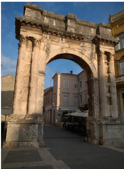
Slika 4. Slavoluk Sergijevaca (Istra Culture (2024) Dostupno na: https://www.istria-culture.com/slavoluk-sergijevaca-i104 (07.05.2024.))

bedemom srušena u 19. stoljeću kao posljedica procesa urbanizacije i proširenja grada na područje izvan zidina. 34