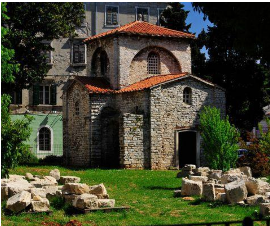
Slika 6. Bazilika svete Marije Formose