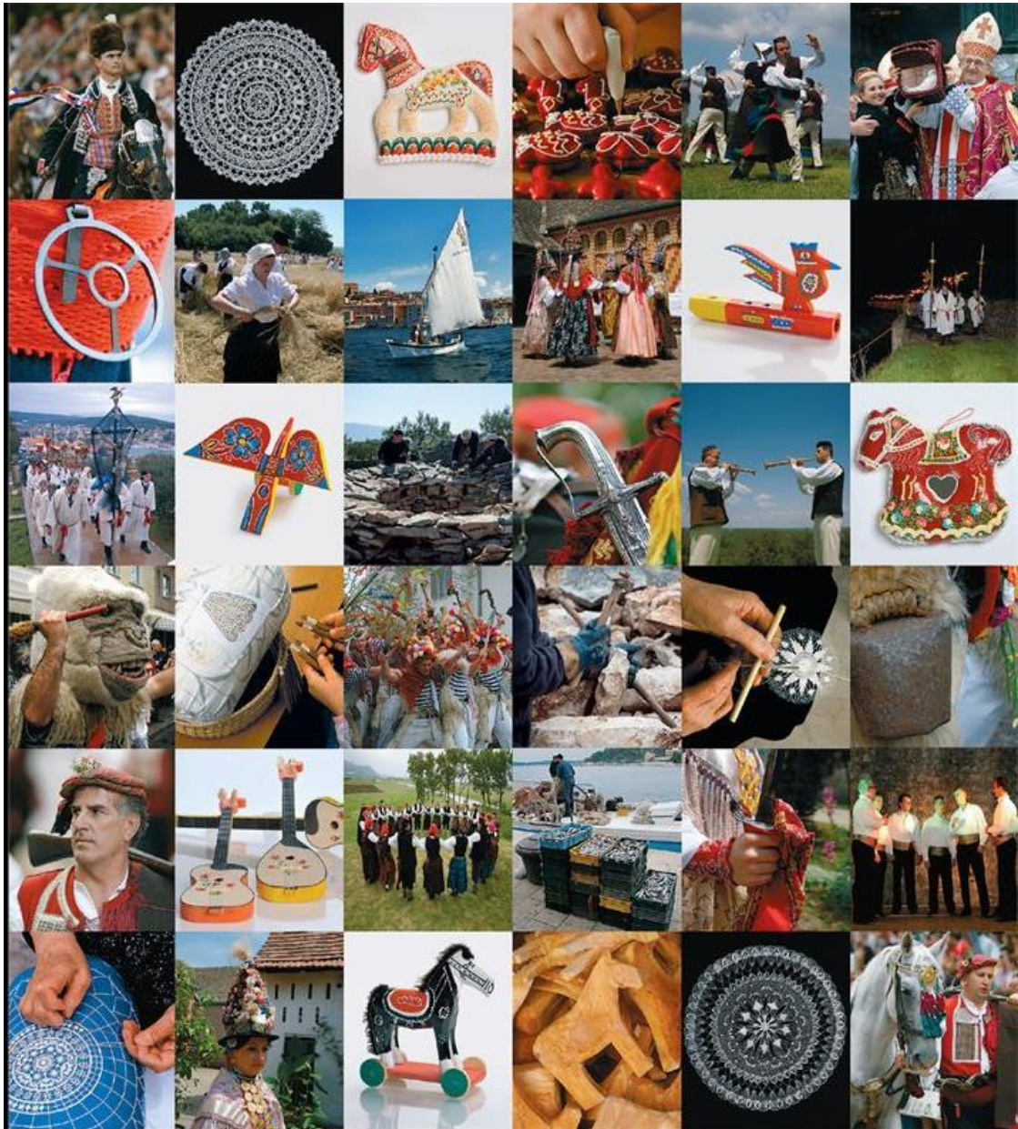
Slika 16. Nematerijalna kulturna baština Republike Hrvatske na UNESCO-ovoj listi (Ministarstvo kulture i medija Republike Hrvatske)

Također, na UNESCO-ovom Popisu svjetske baštine nalaze se i sljedeća nepokretna kulturna dobra s područja Republike Hrvatske i to kako slijedi: