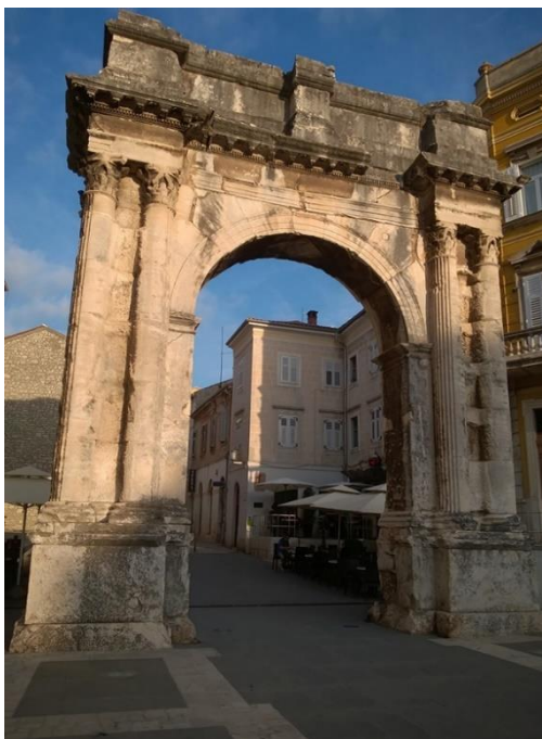
Slika 4. Slaveluk Sergijevaca

bedemom srušena u 19. stoljeću kao posljedica procesa urbanizacije i proširenja grada na područje izvan zidina. 34